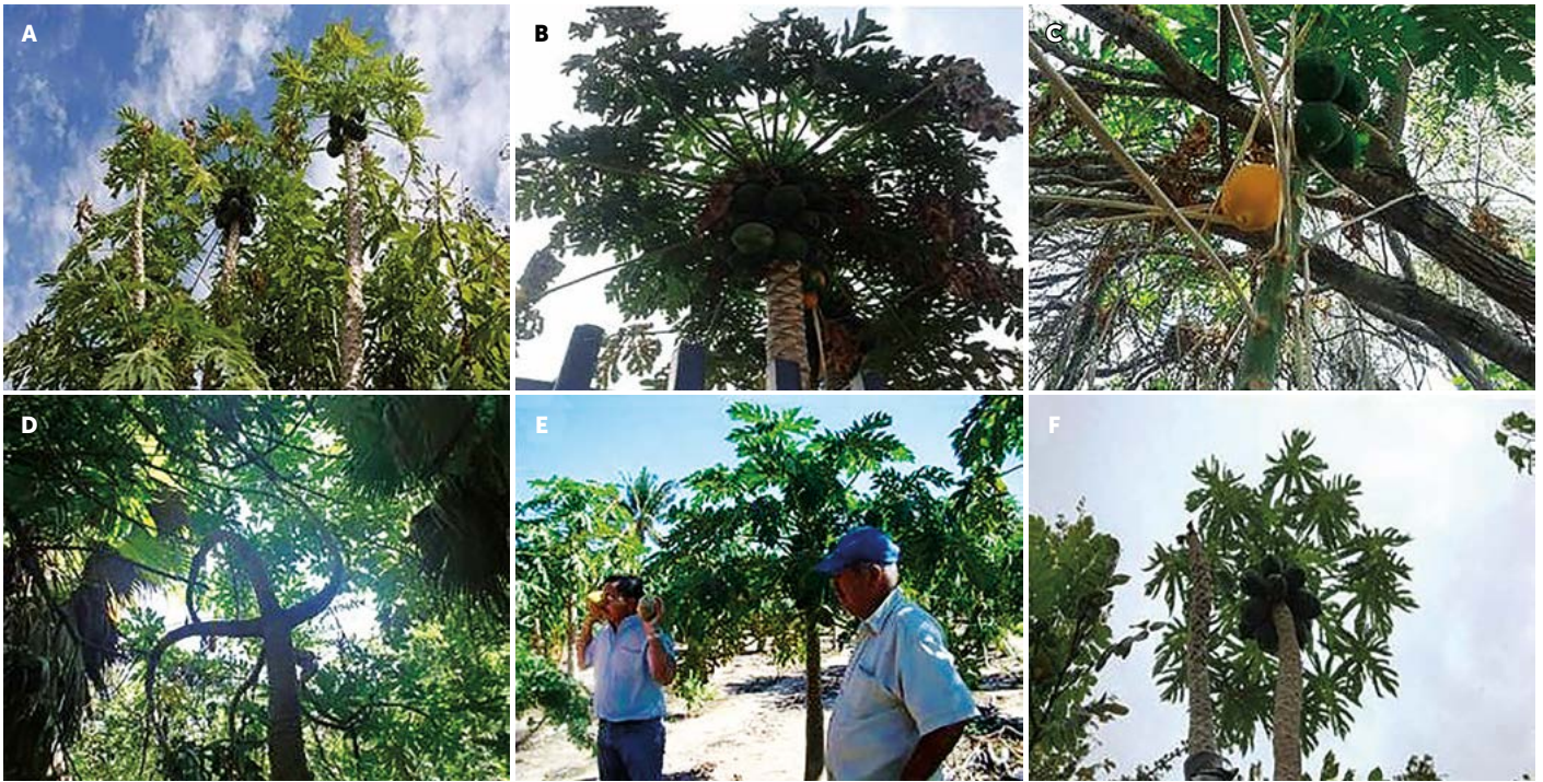
Figura 3. Sitios de recolecta en Baja California Sur: A: San Javier, B: La Paz, C: El Comitán, D: San Bartolo, E: Ejido #2, F: San Miguel de Comondú.