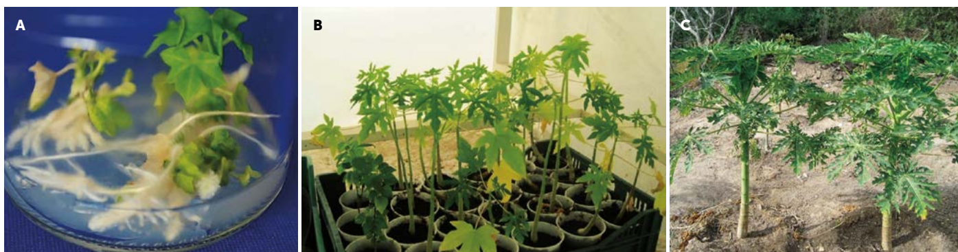
Figura 5. A: Generación de raíces de Carica papaya L., aplicando IBA 3 \mu M. B: adaptación en invernadero. C: Germoplasma ex situ trasplantadas a campo a partir de plántulas in vitro .

identidad y éxito de las accesiones y preservar las características deseables, registrando que una vez establecidas la plantas, el desarrollo fue rápido, logrando propagar el germoplasma de papaya criolla en condiciones in vitro , así como, llevar a cabo su multiplicación en cultivo de tejidos y el desarrollo y mantenimiento ex situ . La colección de germoplasma permite, la reducción de la pérdida de recursos fitogenéticos o erosión genética.