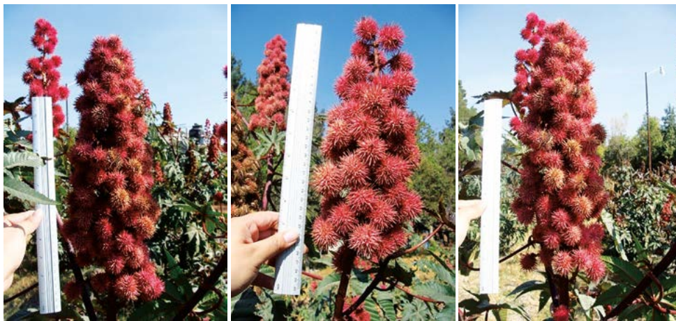
Figura 1. Racimos producidos por la accesión SF7 de Ricinus communis L.

se encontraron diferentes correlaciones entre variables, pero en este análisis destacaron: el peso de cápsulas por planta vs. el rendimiento de semillas (0.9126 Pr=0.0001) y el número de frutos contra número de racimos (0.8562 Pr=0.0001).