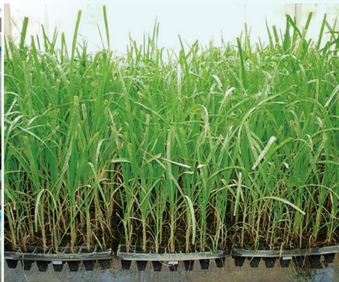
Figura 2. A: Micropropagación de caña de azúcar ( Saccharum spp.) en biorreactores de Inmersión Temporal semiautomatizados. B: Plántulas aclimatadas obtenidas de laboratorios certificados para la producción de material vegetal de caña de azúcar.