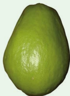
Figura 5. Frutos sanos de chayote con calidad exportación.