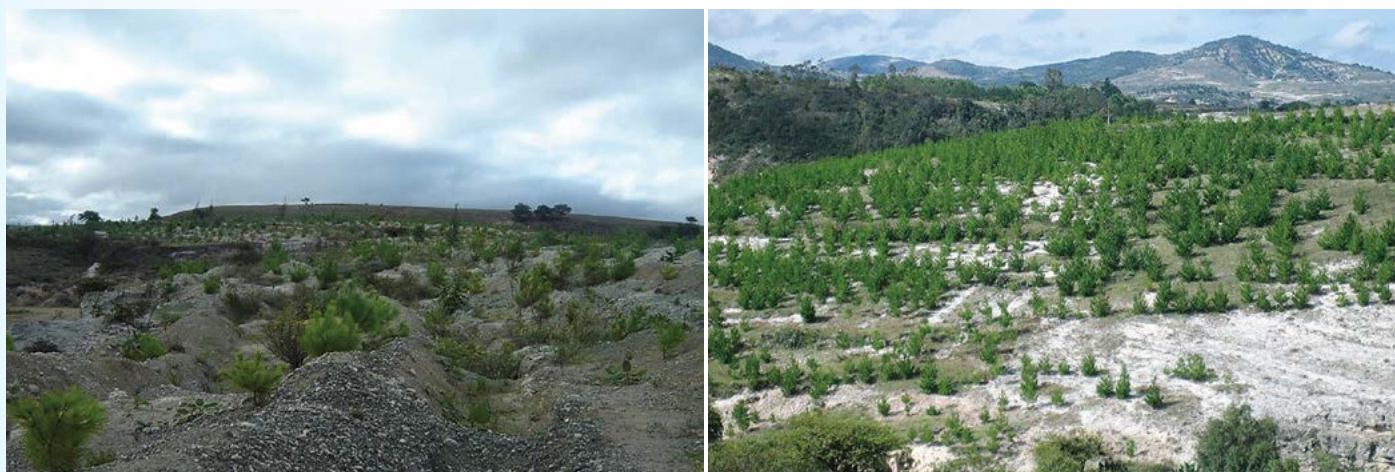
Figura 2. Plantación forestal de un año de edad en San Francisco Teopan, Oaxaca, México.

árboles, lo que indicó una supervivencia aceptable. En San Francisco Teopan la supervivencia fue de 74.48% con densidad de 1031 árboles en promedio, y buena supervivencia, mientras que en Tlacotepec Plumas, la supervivencia promedio general fue de 71% con densidad de 973 árboles y baja mortalidad en los primeros años de establecimiento. El comportamiento en altura mostró una tendencia positiva relacionada directamente con el factor edad en los primeros años de establecimiento de la plantación. La edad en que se cruza el incremento medio anual (IMA) e incremento corriente anual (ICA), en la curva de comportamiento en altura fue a los ocho años, recomendándose un primer pre aclareo a los cuatro años (edad del incremento medio anual máximo).