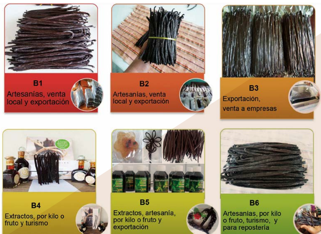
Figura 2. Formas de comercialización de la vainilla ( Vanilla planifolia Jacks. ex Andrews) procesada por cada tipo de beneficiador.

Los resultados de la cuantificación de los cuatro compuestos aromáticos, mostró diferencias significativas entre beneficiadores (B) con su referencia (R) (Cuadro 7). La concentración de ácido p -hidroxibenzoico estuvo