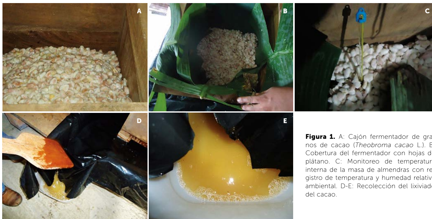
Figura 1. A: Cajón fermentador de granos de cacao ( Theobroma cacao L.). B: Cobertura del fermentador con hojas de plátano. C: Monitoreo de temperatura interna de la masa de almendras con registro de temperatura y humedad relativa ambiental. D-E: Recolección del lixiviado del cacao.