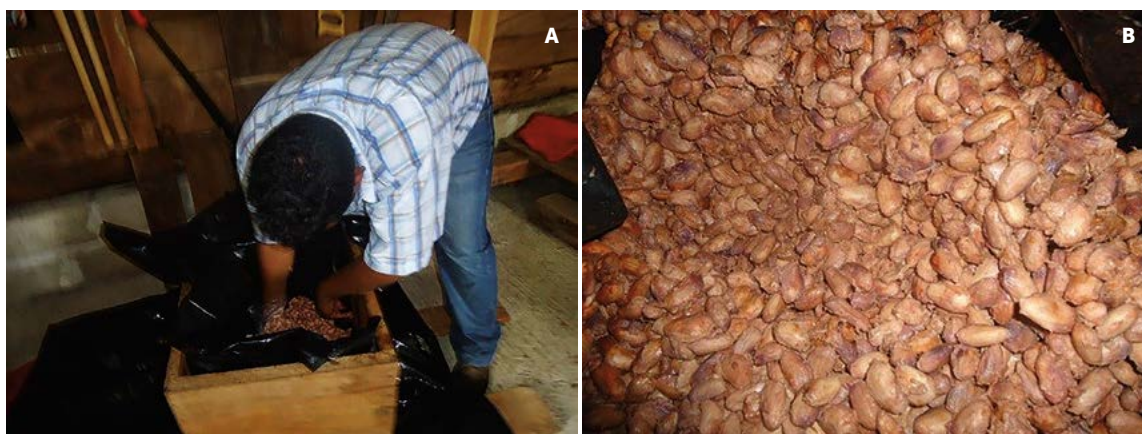
Figura 2. A: Volteo de la masa de cacao ( Theobroma cacao L.) en el fermentador de madera. B: Mezcla homogénea de la masa de cacao.

se cuenta con clones de cacao que se caracterizan por de alto rendimiento que se someten a la fermentación en cajas de madera y secado de los granos en secador tipo invernadero (Figura 4).