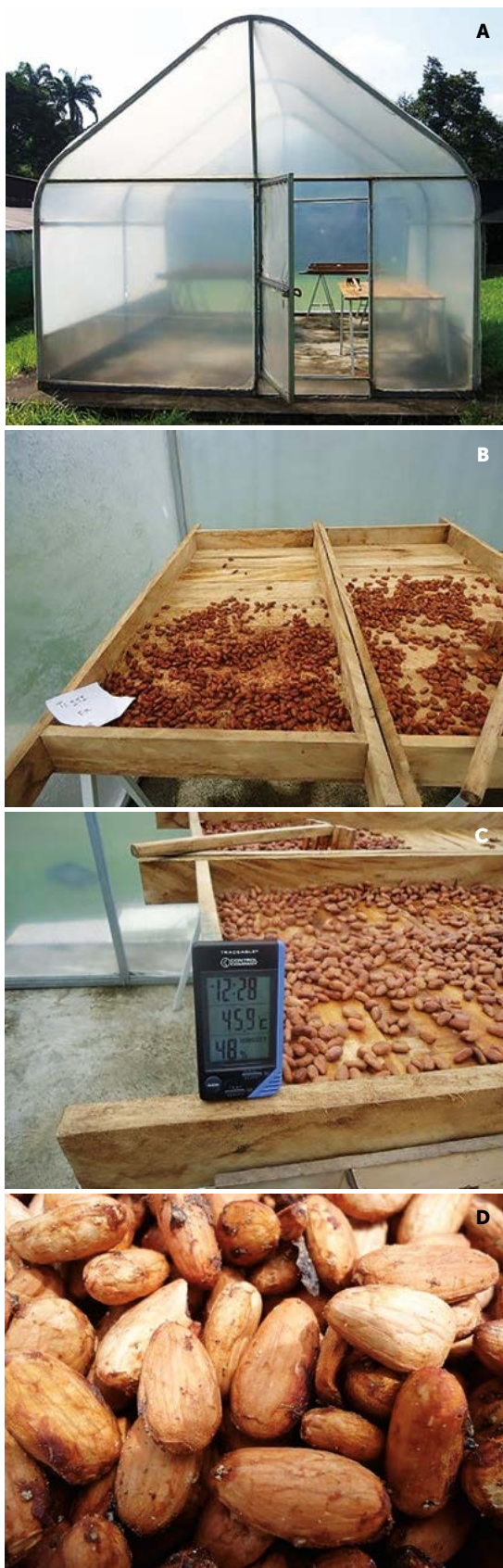
Figura 3. A: Secador solar tipo invernadero. B: Secado de almendras de cacao ( Theobroma cacao L.) en cajones de madera. C: Control de humedad relativa y temperatura en el interior del secador. D: Almendras de cacao al final del secado.

tación (Jinap et al. , 2008), las almendras fermentadas presentan una acidez mayor al 1%, con base en ácido acético. Tomando en cuenta que los granos estudiados en este trabajo se sometieron a fermentación y secado se obtuvieron valores por debajo de los mencionados.