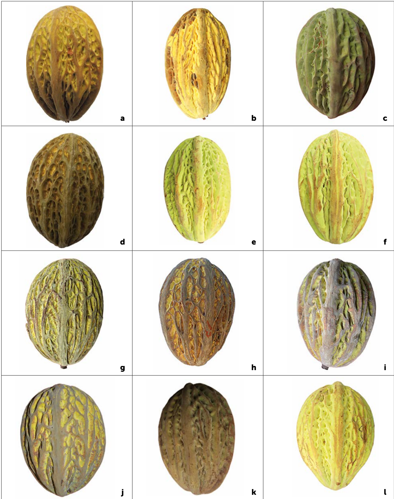
Figura 2. Aspecto externo de las diferentes accesiones de frutos de pataxte ( Theobroma bicolor Humb. & Bonpl.) de México.