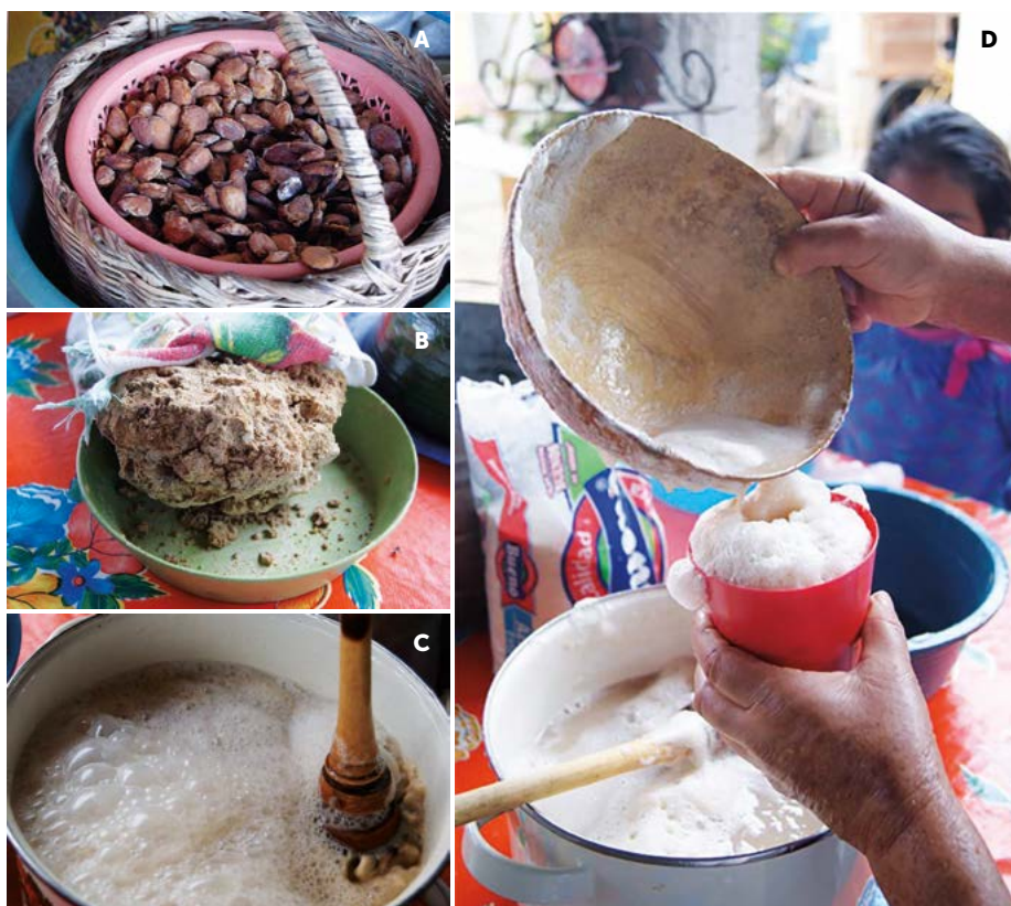
Figura 3. A: Granos secos de pataxte ( Theobroma bicolor Humb. & Bonpl.) B: Masa base para elaboración de la bebida "popo". C: Bebida "Popo" previa a su agitación. D: Bebida "popo" listo para su consumo.