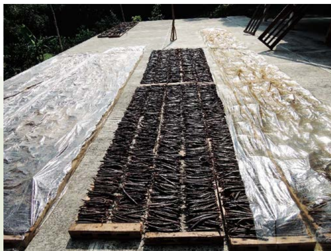
Figura 1. Beneficiado tradicional del fruto de Vanilla planifolia Jacks. ex Andrews.