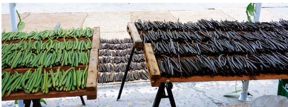
Figura 3. Frutos de Vanilla planifolia Jacks. ex Andrews, y de diferentes localidades de Puebla y Veracruz, México; verdes y sometidas a distintos esquemas de beneficiado.