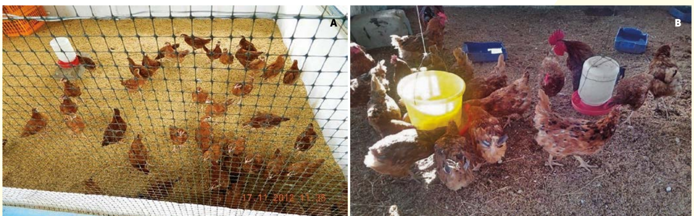
Figura 1. A: Población inicial de aves con gallinero de cama profunda con pajilla de café. B: Aves en confinamiento por doce horas al día.

La evaluación de producción inició en la primera semana de abril y concluyó después de 52 semanas de postura, cuantificando los huevos recolectados. Así mismo, se calculó la relación beneficio/costo, el valor actual neto y tasa interna de rentabilidad. El abono suministrado al cafetal se calculó con el método propuesto por Guelber et al. (2009) y el aporte de nutrientes se realizó de acuerdo a la NOM-021-REC-NAT-2000, comparando este dato