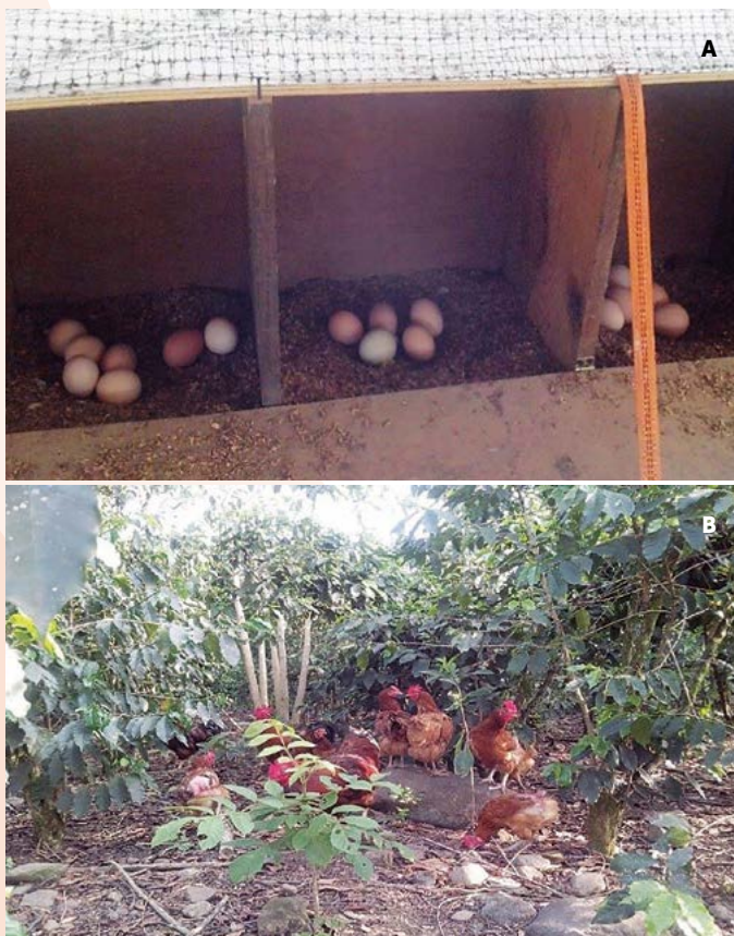
Figura 2. A: Cabinas de postura al interior del gallinero. B: Gallinas pastoreando en el cafetal y consumiendo malezas.

Durante la investigación se registraron pérdidas por deceso (22.45%), extravío (60%) o abigeato y 40% por depredación por fauna silvestre; tales como, tlacuache ( Didelphis marsupialis L), comadreja u onzita ( Mustela frenata Lichtenstein) y zorra ( Urocyon cinereoargenteus Schreber) observados en el área de pastoreo, a diferencia de lo reportado por Jerez et al. (1994), quienes reportan bajas del 32% en condiciones de traspatio por problemas con Newcastle. González et al. (1995) reportaron 28.3% de bajas en condiciones de poco cuidado sanitario y Rodríguez (1996) una mortalidad del 28.4% debido a coccidiosis e infecciones respiratorias. La ausencia de problemas sanitarios en este estudio puede deberse al uso de la cama profunda, la cual evita acumulación de humedad, moscas y otros agentes patógenos que afecten a las aves.