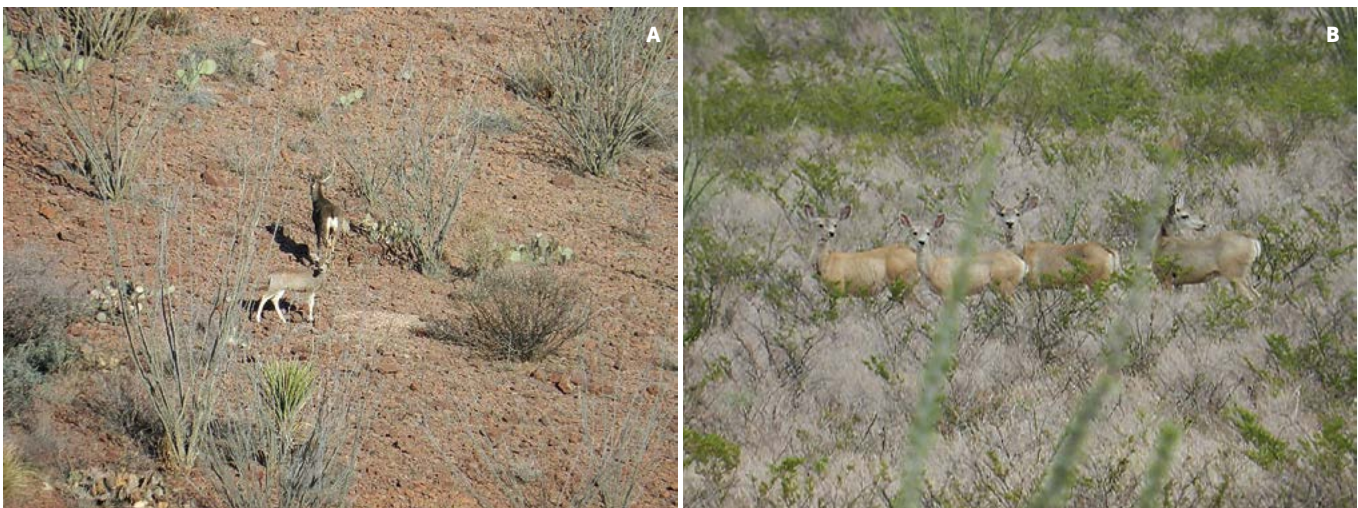
Figura 2. A: Macho y hembra de venado Bura ( Odocoileus hemionus Crooki) en matorral mediano subinermé. B: Venados bura en matorral desértico en Chihuahua, México.