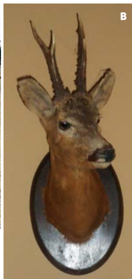
Figura 2. A: Hembras y crías de ciervo rojo ( Cervus elaphus ) en un rancho cinegético en España. B: Trofeo de corzo ( Capreolus pygargus ) cosechado por aprovechamiento cinegético en España.