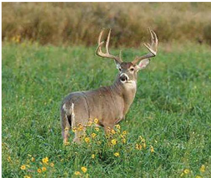
Figura 3. Venado cola blanca texano ( Odocoileus virginianus texanus ) que se distribuye en la región noreste de México.

En el laboratorio de Reproducción y Genética de Fauna Silvestre del Colegio de Postgraduados, Campus San Luis Potosí, desde 2012 se lleva a cabo un estudio sobre la filogeografía del venado cola blanca ( Odocoileus