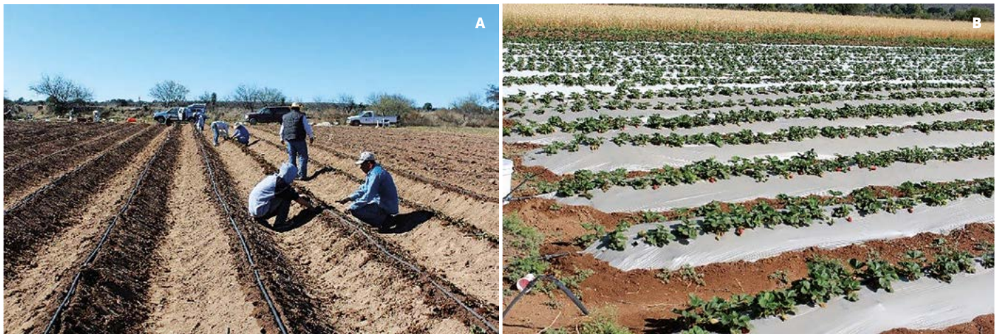
Figura 1. A: Bordos donde se estableció la planta de fresa ( Fragaria fragaria × ananassa (Weston) Duchesne). B: Acolchado del cultivo de fresa con plásticos blanco/negro y plata/negro, ambos en La Cócana, Ejido Diego Martín, Salinas, San Luis Potosí, México.

fertilización con nitrógeno (N) 335 \text{ mg kg}^{-1} , fósforo (P) 121 \text{ mg kg}^{-1} , potasio (K) 389 \text{ mg kg}^{-1} , calcio (Ca) 182 \text{ mg kg}^{-1} , magnesio (Mg) 31 \text{ mg kg}^{-1} , hierro (Fe) 1.44 \text{ mg kg}^{-1} , manganeso (Mn) 0.90 \text{ mg kg}^{-1} , cobre (Cu) 0.12 \text{ mg kg}^{-1} , zinc (Zn) 0.10 \text{ mg kg}^{-1} y boro (B) 3.91 \text{ mg kg}^{-1} . Con estos se prepararon dos soluciones madre en tanques de 1000 L; en el tanque A se disolvió el nitrato de calcio y nitrato de potasio; en el B se disolvió el fosfato mono potásico, el sulfato de magnesio y los micro-elementos. Las soluciones madre se aplicaron al 75% en el agua de riego mediante un sistema de inyección Venturi. En cada riego se agregó ácido nítrico para llevar el pH de la solución del suelo a 6.5. Además, semanalmente se aplicó fertilizante foliar, y en época de lluvia se aplicó fungicida preventivo Cupravit (Oxicloruro de cobre 85%); en una sola ocasión un curativo Cercobin M (Tiofanato metílico: Dimetil-4,4-O-Fenilenbis (3-tioalofanato al 70%).