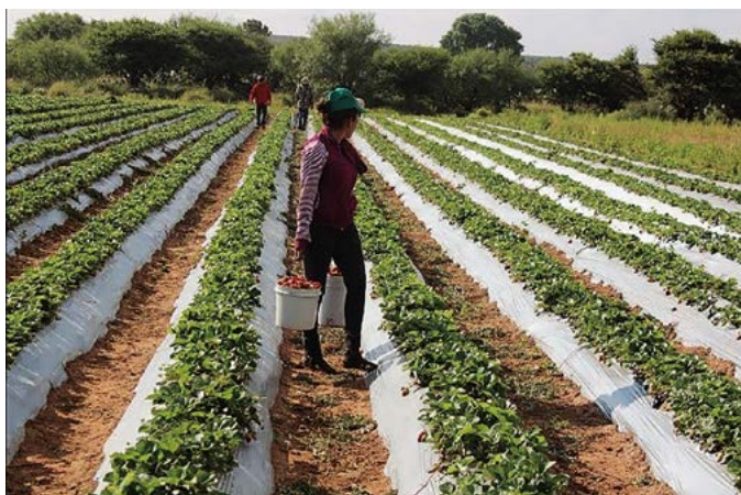
Figura 2. Producción de fresa por surco ( Fragaria fragaria × ananassa (Weston) Duchesne) en La Cócana, Ejido Diego Martín, Salinas, S.L.P.

fertilización con nitrógeno (N) 335 \text{ mg kg}^{-1} , fósforo (P) 121 \text{ mg kg}^{-1} , potasio (K) 389 \text{ mg kg}^{-1} , calcio (Ca) 182 \text{ mg kg}^{-1} , magnesio (Mg) 31 \text{ mg kg}^{-1} , hierro (Fe) 1.44 \text{ mg kg}^{-1} , manganeso (Mn) 0.90 \text{ mg kg}^{-1} , cobre (Cu) 0.12 \text{ mg kg}^{-1} , zinc (Zn) 0.10 \text{ mg kg}^{-1} y boro (B) 3.91 \text{ mg kg}^{-1} . Con estos se prepararon dos soluciones madre en tanques de 1000 L; en el tanque A se disolvió el nitrato de calcio y nitrato de potasio; en el B se disolvió el fosfato mono potásico, el sulfato de magnesio y los micro-elementos. Las soluciones madre se aplicaron al 75% en el agua de riego mediante un sistema de inyección Venturi. En cada riego se agregó ácido nítrico para llevar el pH de la solución del suelo a 6.5. Además, semanalmente se aplicó fertilizante foliar, y en época de lluvia se aplicó fungicida preventivo Cupravit (Oxicloruro de cobre 85%); en una sola ocasión un curativo Cercobin M (Tiofanato metílico: Dimetil-4,4-O-Fenilenbis (3-tioalofanato al 70%).