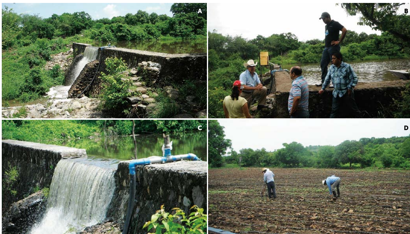
Figura 2. A-C: Represa que recoge escurrimientos pluviales. B: Productores, Técnicos e Investigadores integrados en el proyecto. D: Aplicación de riego presurizado.

introducción de hortalizas de invierno micro-irrigadas. En el 2012 se ferti-irrigaron 1.5 ha (tres ciclos por año) con un rendimiento equivalente de 5 \text{ t ha}^{-1} por ciclo y una parcela con frijol en 0.4 ha que produjo un rendimiento equivalente a 1.8 \text{ t ha}^{-1} . La relación beneficio costo en el área utilizada fue de 3:1. Durante cada año los productores vendieron el maíz tanto en elote (fisiológicamente inmaduro) como en grano, según los precios del momento. En 2012-2013 la misma parcela de frijol rindió 2.4 \text{ t ha}^{-1} y en 2014, una de 540 \text{ m}^2 produjo el equivalente a 3.3 \text{ t ha}^{-1} . Desde el 2013 se les ha estado capacitando en el sistema intensivo de producción de hidroponía orgánica con sub-riego automático, sin el uso de bombas o contadores de tiempo ni dosificación de soluciones nutritivas. Se sembraron 4000 mojarra tilapia en la represa. A la fecha están en operación tres hectáreas y cuatro bebederos automáticos para el ganado. En 2013 y 2014 han surgido problemas con un grupo de ejidatarios (4 de 80) que aun teniendo habilitada su parcela, no desean que el proyecto continúe. En ese tiempo la capacitación profundizó en temas completamente nuevos para los productores (relaciones agua-suelo-atmósfera) expuestos de manera comprensible usando un léxico sencillo; así, gradualmente se van haciendo cargo del sistema y aportando también sus conocimientos prácticos en mu-