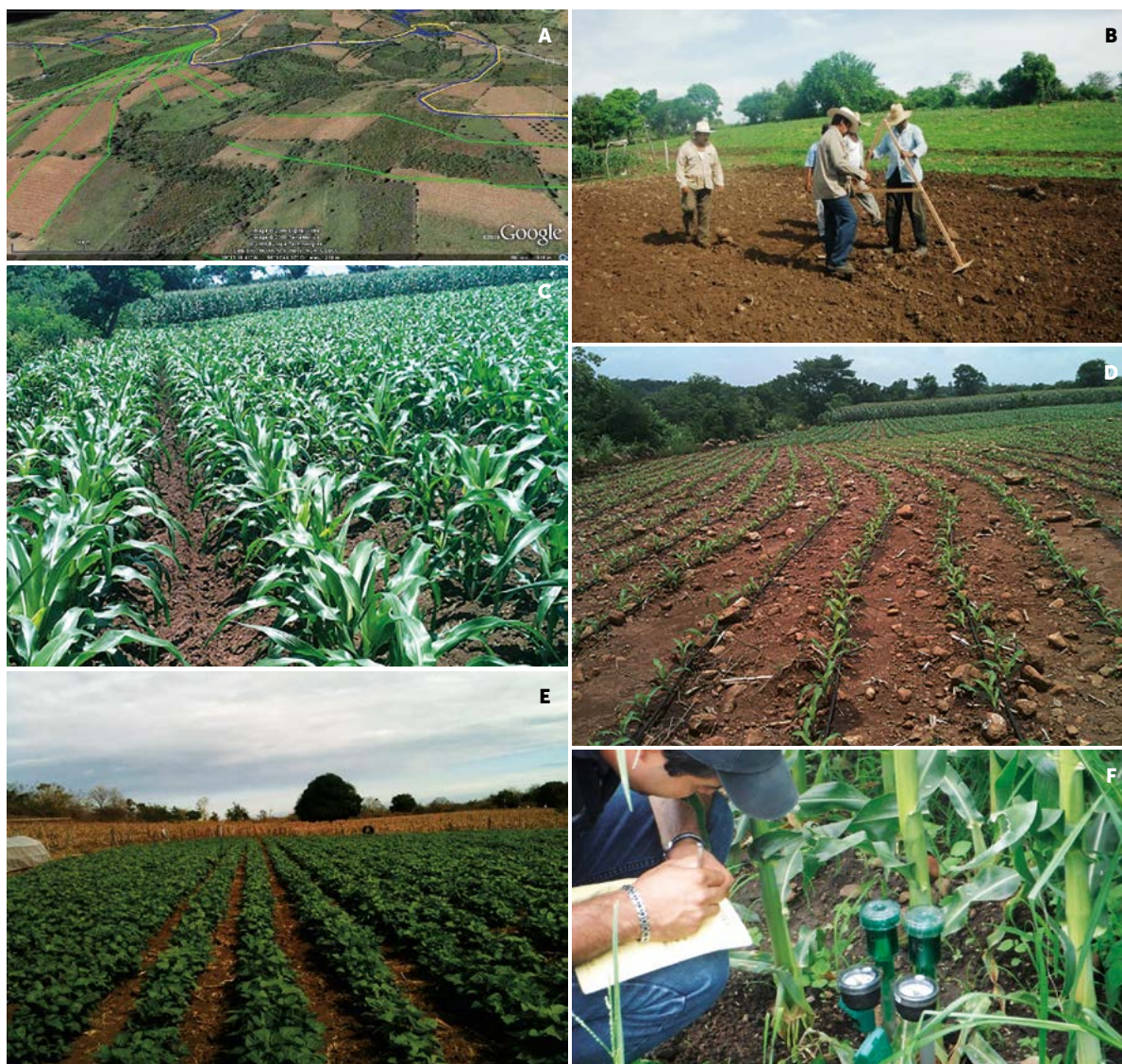
Figura 3. A: Trazo general de irrigación. B-D: Trazo de curvas a nivel con triángulo "A" para siembra de maíz. E: Siembra de frijol. F: Registro de datos en tensiómetros.

mostrarán un cambio positivo como el que se espera; y se estará en condiciones de tomar ventaja de los efectos de las lluvias torrenciales que llenen rápidamente las pequeñas represas, con lo que se podrá mejorar la calidad de vida de los pobladores del ámbito rural.