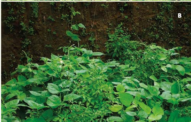
Figura 2. A: Planta de chile piquín. B: Tipos de chile semidomesticado en condiciones de selva baja en la zona Huasteca, en México.