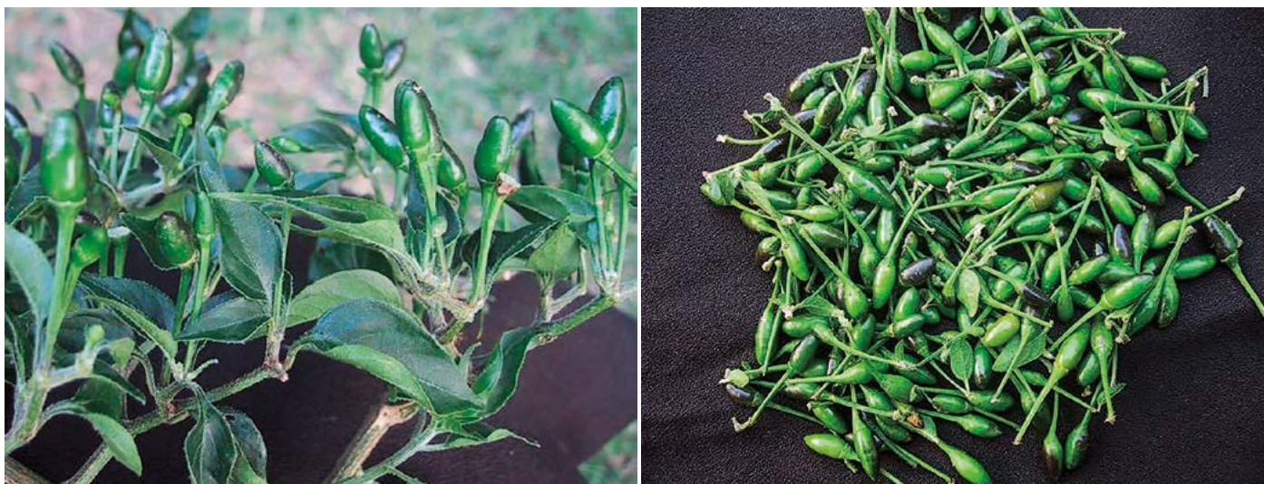
Figura 4 Chile piquín huasteco, uno de los tipos de chile semidomesticado más importante de la zona Huasteca.

550 m. Presenta plantas compactas de 60 a 80 cm de altura y cobertura de follaje de 45 a 50 cm; sus hojas presentan pubescencia moderada a intensa. Sus frutos pueden estar en posición pendiente y/o erecta, son de forma cónica a cónica alargada y de color verde claro a verde esmeralda que cambia a rojo oscuro en madurez total. Los frutos del chile pico de paloma tienen una longitud de 1.0 a 2.5 cm y diámetro de 0.8 a 1.2 cm (Figura 6). Generalmente se comercializa como fruto maduro seco.