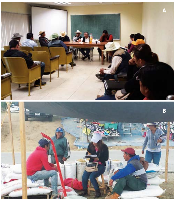
Figura 3. A: Productores rurales asociados a una organización que asisten a reuniones. B: Productores no asociados que comercializan sus productos por cuenta propia.

La problemática que enfrentan estas organizaciones tiene que ver con su funcionamiento interno y la falta de recursos para la compra de insumos, la inversión en tecnología y la mejora de sus procesos productivos para incrementar productividad, por lo que una estrategia que deberá ser impulsada por el gobierno y las instituciones que participan en el territorio es atender dicha problemática a través de capacitación técnica, de gestión administrativa y buscar los mecanismos que permitan a los productores financiar sus actividades productivas.