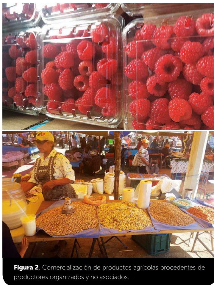
Figura 2. Comercialización de productos agrícolas procedentes de productores organizados y no asociados.

La encuesta a representantes de organizaciones locales cuyo fin fue identificar tanto su participación, como su funcionamiento e impacto en el desarrollo del territorio a través de la generación de empleo y gestión de apoyos gubernamentales, registró cuatro organizaciones