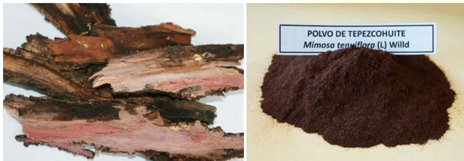
Figura 3. Corteza tostada y molida de Tepezcohuite ( Mimosa tenuiflora (L) Willd).

Gaujac y Aquino (2012), indican que en un estudio realizado para detectar en extracto de corteza de M. tenuiflora N,N-dimetiltriptamina o DMT (alucinógeno potente), del cual se acepta una concentración máxima de 0.12 \text{ mg g}^{-1} , se registró en 24 muestras concentraciones desde 1.26 \text{ mg g}^{-1} hasta 9.35 \text{ mg g}^{-1} , lo que sugiere que una mala administración en recetas tradicionales vía oral o masticado, puede provocar efectos eméticos inmediatos (vómito y purgante), antes de que