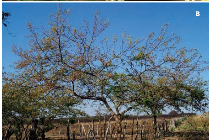
Figura 1. Inflorescencia y árbol de Tepezcohuite ( Mimosa tenuiflora (L) Willd) en áreas ganaderas como cerco vivo.