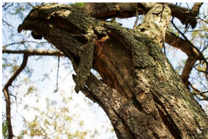
Figura 2. Corteza de Tepezcohuite ( Mimosa tenuiflora (L) Willd).