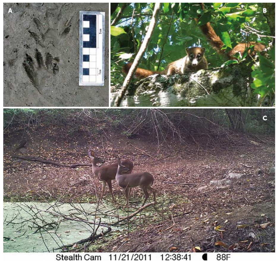
Figura 1. Evidencias de registro de la diversidad y abundancia de presas del jaguar ( Panthera onca ) y puma ( Puma concolor ) en la RBSAT obtenidas mediante foto trapeo. A: Huellas de mapache en lodo ( Procyon lotor ). B: Avistamiento de tejón ( Nasua narica ). C: Venados cola blanca ( Odocoileus virginianus ).

A través de las tres técnicas se registraron un total de 25 especies de mamíferos medianos y grandes, así como, 14 de aves (Cuadros 1 y 2). La mayoría de los mamíferos fueron registrados por el foto trapeo e identificación de rastros; y únicamente la especie de zorrillo ( Mephitis macroura ) y un marsupial ( Marmosa mexicana ) se registraron sólo a través de la observación directa.