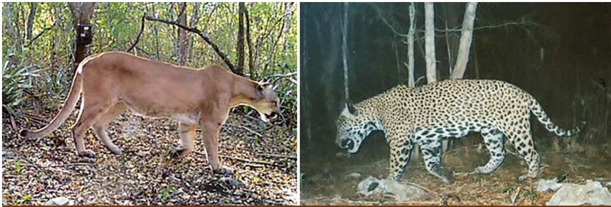
Figura 3. Evidencia de la presencia del Puma ( Puma concolor ) y Jaguar ( Panthera onca ) en la RBSAT, San Luis Potosí, México.