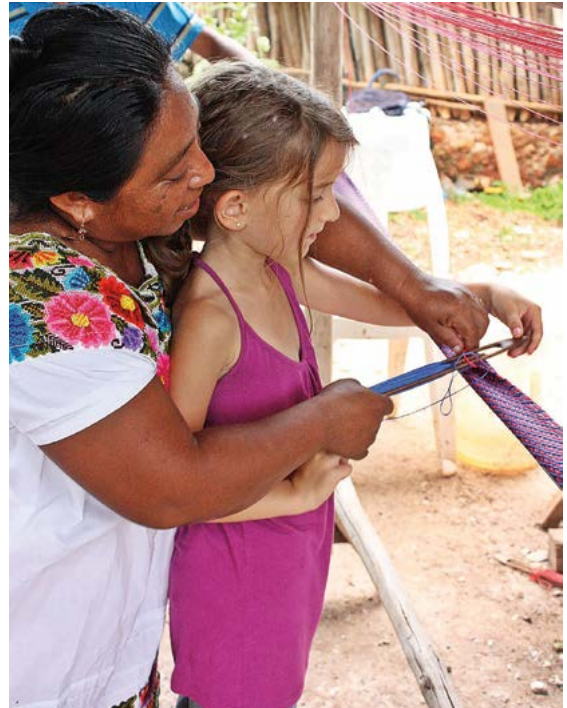
Pobladora de Ek Balam enseñando a hurdir a una joven turista.