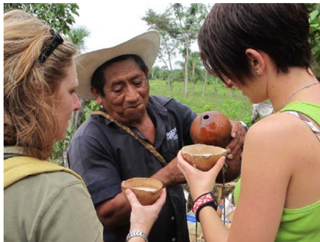
Campeño de Ek Balam compartiendo el pozole de coco.

psicológico, social y político de los habitantes involucrados en el turismo, ya que a algunos de los socios les ha dado la oportunidad de salir de su comunidad con destinos nacionales y al extranjero, por lo que muestran mayor interés en la actividad. La importancia de que sean promovidos internacionalmente es que ellos sienten orgullo al ver sus fotografías en folletos que circulan en países como Francia. Para los miembros de la Sociedad cooperativa el turismo es una actividad complementaria y, aunque no ha logrado un empoderamiento económico, hay que remarcar que la