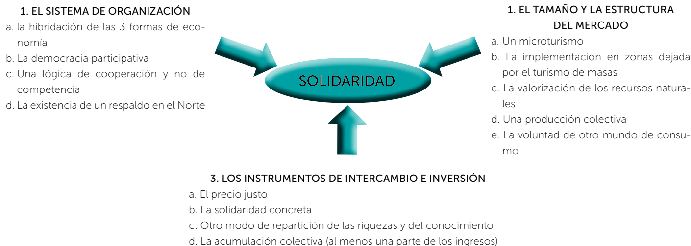
Figura 2. Implementación de un turismo sustentable a través del turismo solidario, de acuerdo con Caire y Roullet-Caire (2003).