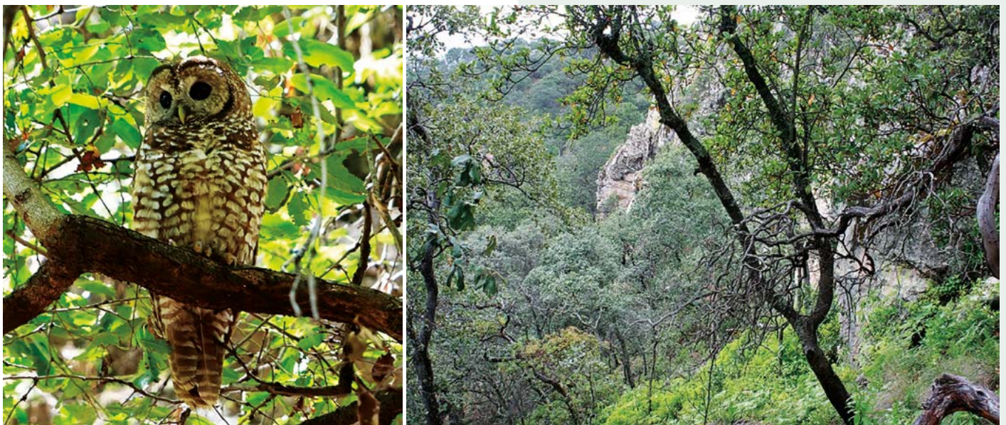
Figura 1. A: Tecolote moteado mexicano ( Strix occidentalis lucida ). B: Hábitat del tecolote. Registros en Tlachichila, Zacatecas, México.

El área de estudio se localizó en la comunidad de Tlachichila, Municipio de Nochistlán de Mejía, al sur del estado de Zacatecas, México. El clima en la región es templado