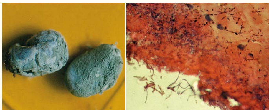
Figura 2. Garrapatas del género Boophilus spp. infectadas de Metarhizium anisopliae (Metschinkoff) y en pleno desarrollo de la fase de colonización (producción de conidios). Efecto de las hifas de hongo Metarhizium anisopliae , (Metschinkoff) sobre la cutícula de garrapatas adultas (corte histológico de la cutícula), CUNORI.

En la prueba in vivo realizada para determinar la efectividad de M. anisopliae en garrapatas del género Boophilus spp., en su fase parásita sobre huéspedes bovinos estabulados, se observó que los tratamientos mostraron diferencias altamente significativas en la efectividad (Cuadro 2). Es de hacer notar que el efecto placebo no fue la aplicación de dicho tratamiento, sino por el efecto animal de liberarse de las garrapatas. Sin embargo, el comportamiento de las cepas del hongo M. anisopliae evaluadas con respecto a su efectividad en los diferentes conteos efectuados post-aplicación demostraron que ambas aumentan de forma lineal, haciéndose más notorio a partir de las 72 horas. Además, se muestra