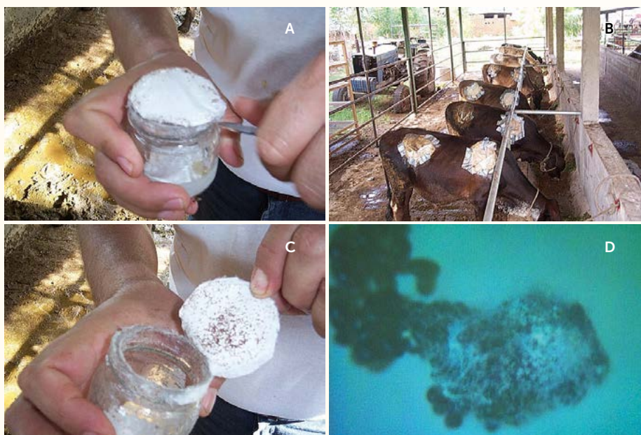
Figura 1. A: Aplicación de larva (L1) de Boophilus spp., en bovinos. B: Terneros sometidos a la prueba de respuesta animal. C: Frascos conteniendo L1 de Boophilus spp., 4000 por unidad. D: Huevos de larva (L1) invadidos por el micelio de Metarhizium anisopliae .

Se determinó efectuando un conteo previo a la aplicación de los tratamientos y luego cada 24 horas por cinco días para establecer el número de garrapatas adultas muertas y vivas que aún se hospedaban en cada cámara. El porcentaje de eficiencia de los productos