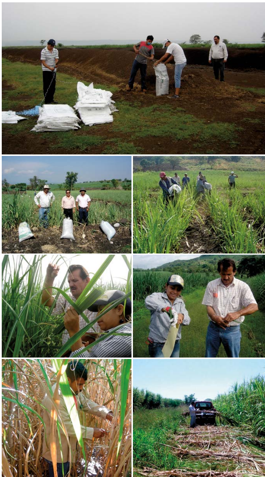
Figura 2. Detalles de la aplicación de composta y medición de algunas variables de estudio para evaluar las dosis de fertilización del SIRDF en el área del Ingenio Pujiltil durante marzo de 2012. A: Llenado de costales de composta en el módulo de la delegación de cañeros. B: Aplicación de composta. C: Muestreo foliar. C: Muestreos de jugo en tallo para determinación de grados Brix. D: Muestreo de tallo moledero para estimación del rendimiento.

Diagnóstico foliar. A los cuatro meses de edad se determinó el estado nutricional del cultivo. En cada tratamiento se tomaron 15 hojas en un recorrido en zig-zag, colectando la hoja número 4, a las cuales se les eliminó base, punta y nervadura (Figura 2 C) y se transportaron al laboratorio donde fueron secadas en estufa a 70 \text{ }^\circ\text{C} por 72 horas y molidas para determinar la concentración NPK. En total se colectaron 33 muestras foliares (11 parcelas \times 3 tratamientos).