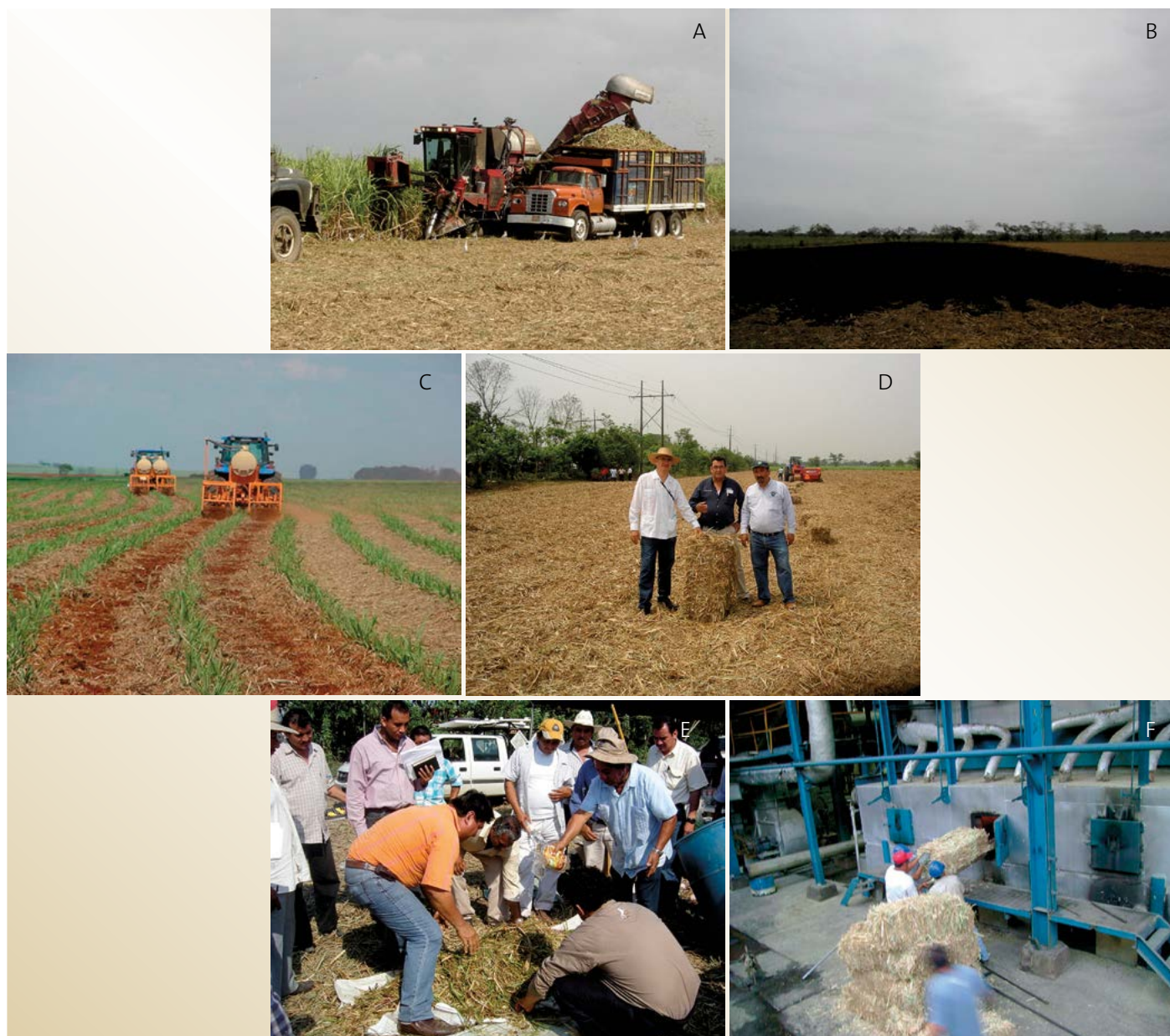
Figura 2. Manejo y usos potenciales de la paja de caña de azúcar en el Ingenio Presidente Benito Juárez en Tabasco, México. A: Plantación de caña de azúcar bajo el sistema de “cosecha en verde” mecanizada. B: Quema de paja bajo el sistema de “cosecha en verde”. C: Incorporación de paja con multi-cultivador. D: Empacado de paja en pacas de 30 kg. E: Preparación de alimentos para bovinos a base de puntas de caña. F: Utilización de paja como combustible en las calderas del ingenio.

cuantificar diferentes usos y métodos para la recoleta de paja; uno de estos podría ser a través de la incorporación con multicultivador que permitiría aprovechar hasta 50% de la paja generada para mantener el reciclaje de nutrimentos y evitar la pérdida de fertilidad en los suelos (Lal, 2009), tal como hacen en otros países cañeros donde se practica la