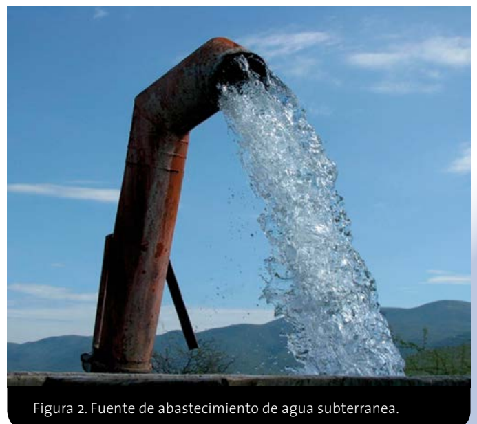
Figura 2. Fuente de abastecimiento de agua subterránea.

El municipio de Tula, Tamaulipas, México, localizado en una zona árida, corresponde al acuífero denominado Tula-Bustamante (Figura 3), el cual tiene una disponibilidad de 21.5 millones de metros cúbicos. Esta fuente corresponde a una cuenca cerrada que da lugar a una unidad acuífera de origen aluvial propenso a suministrar una deficiente calidad de agua (Jones y Schilling, 2011; Korbelt et al. , 2013), debido a procesos como la interacción roca-agua y