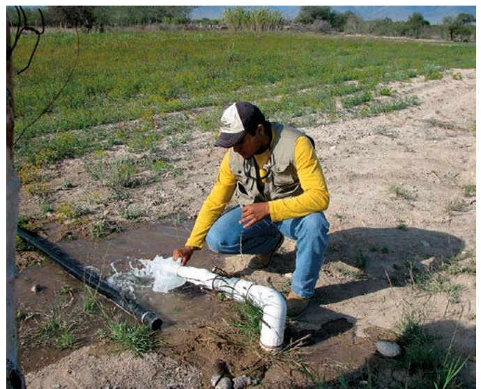
Figura 5. Uso agrícola de agua de origen subterráneo en Tula, Tamaulipas, México.