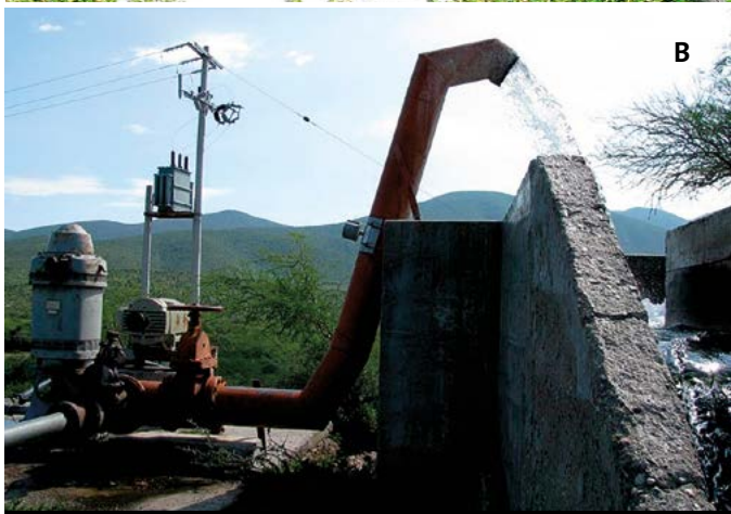
Figura 1. Sistemas de extracción de agua subterránea en el municipio de Tula, Tamaulipas, México. A: noria. B: pozo profundo.

Las ventajas del agua subterránea sobre las fuentes de abastecimiento superficial son: menor riesgo de contaminación por actividades del hombre, que presenta mejor calidad debido a procesos de filtración natural en el subsuelo (en la mayoría de los casos), así como menor riesgo a alteraciones y mayores capacidades de almacenamiento sin comprometer áreas en la superficie (Figura 2). Sin embargo, como desventajas se tiene la contaminación natural, vulnerabilidad a procesos de degradación y salinización en casos de sobreexplotación (Silva-Hidalgo et al. , 2013).