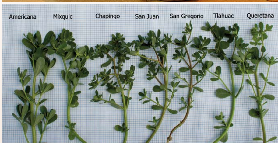
Figura 2. A: Mesa de discusión de productores. B: Diferentes formas de verdolaga cultivada.