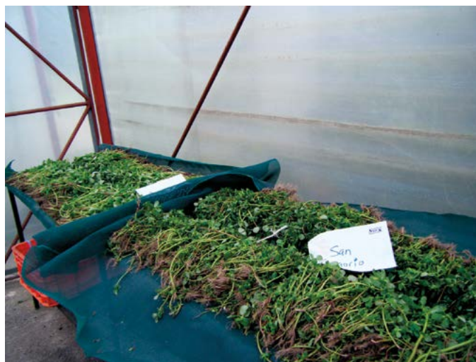
Figura 4. Secado de muestras.

Estos primeros ensayos muestran un potencial favorable de la verdolaga como fuente vegetal alternativa de omegas 3 y 6. Los materiales arvenses permiten un parámetro de comparación de la especie, debido a que se encuentra