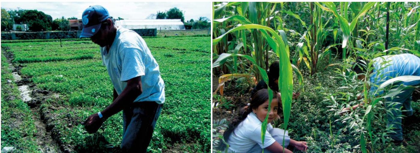
Figura 3. Colecta de planta cultivada y arvense.

Varian (Varian Inc., CA, USA), usando una mezcla pura de estándares (C4-C24 SUPELCO 18919) para determinar el tiempo de retención de cada uno de los ácidos.