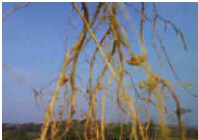
Figura 2. Sistema radical de Clitoria ternatea con presencia de nódulos.

aplicados en B. brizantha , superaron al testigo y fueron estadísticamente superiores, mientras que en C. ternatea la producción más alta se logró con el tratamiento biofertilizado con R. intraradices . Este resultado evidencia la importancia de los microorganismos en el sistema radical de las plantas, que seguramente favorecen la acumulación de reservas (carbohidratos) para ser utilizadas después del corte y favorecer el rebrote. Es importante considerar que el rebrote de las especies forrajeras se produce mediante el transporte de carbohidratos no estructurales de la base del tallo y raíces a los meristemos aéreos remanentes, después de realizada la defoliación (Hernández y Ramírez, 1986); los cortes frecuentes o pastoreo severo disminuyen considerablemente la disponibilidad de carbohidratos y ocasionan baja tasa de rebrote.