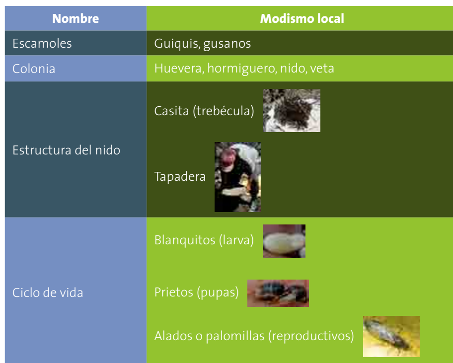
Figura 3. Modismos locales de los escamoleros de Santa Isabel-El Coto y El Coto.