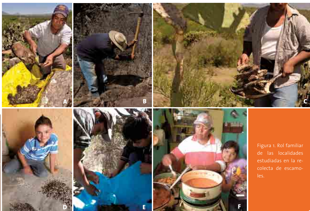
Figura 1. Rol familiar de las localidades estudiadas en la recolecta de escamoles.

En la recolecta y el manejo de escamoles, los miembros de la familia tienen distintas funciones (Figura 1). Usualmente ésta se realiza en grupos de cuatro personas como máximo (promedio 2.1, n=14 ) y generalmente son familiares.