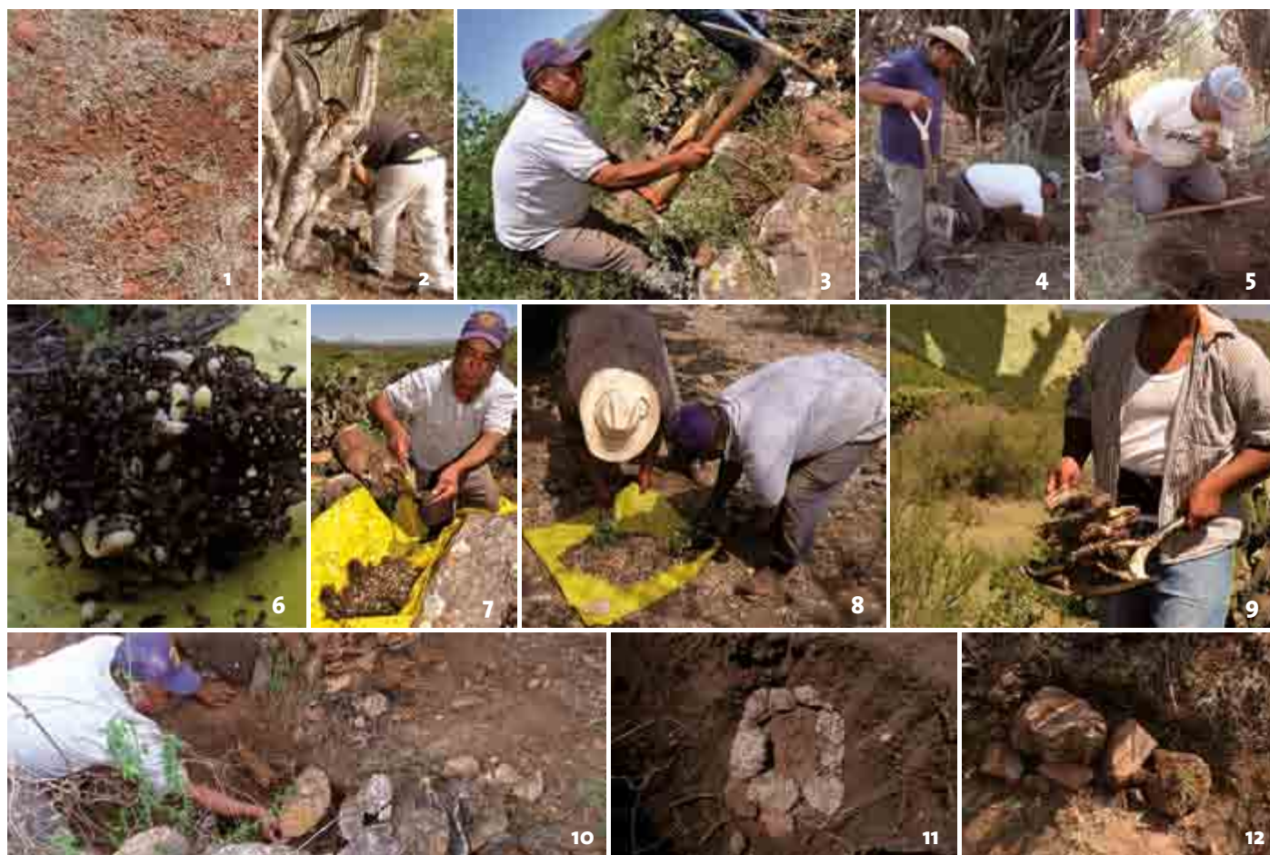
Figura 2. Secuencia de las tipologías de manejo: 1) Extractiva (1-8); 2) Extractiva-Relleno-Tapado (1-12).

a los intermediarios. En la localidad existen 27 grupos de escamoleros; si cada uno recolecta y entrega 3 kg por día (promedio del año 2012), la compra total del intermediario es de 81 kg, con un precio de $29,646.00.