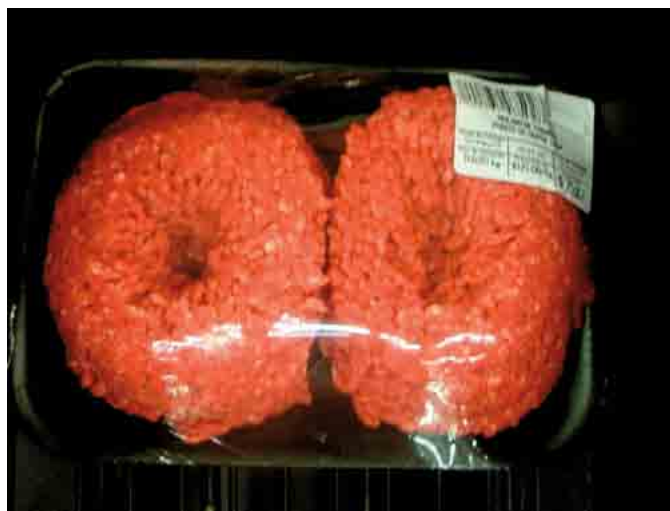
Figura 2. Nanoempaques para la conservación de la carne.

Se ha demostrado que los Ae tienen propiedad antimicrobiana frente a bacterias patógenas que se desarrollan en hamburguesas. El Ae de orégano ( Origanum vulgare ssp. Hirtum ) fue el más activo y se estableció que la microencapsulación con goma arábiga como material de pared favorece su conservación, vehiculización y dosificación (González, 2007). Las microencápsulas de Ae de romero ( Rosmarinus officinalis L.) son más efectivas que el aceite sin encapsular, frente a Listeria monocytogenes en salchichas de hígado de cerdo (Pandit y Shelef, 1994). El uso de nanopartículas y nanocapsulados en alimentos y empaques alimenticios deben estar sujetos a pruebas de seguridad, antes de ser incluidos en el comercio de los productos de alimentos (Sorrentino et al. , 2007). En la actualidad algunos nanocompuestos ya son usados como material de embalaje o recubrimiento, para controlar la difusión de gases y prolongar el tiempo de conservación (Figura 3).