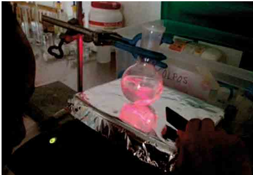
Figura 1. Preparación de dispositivos nanométricos de microminerales de la columna.

La calidad de la carne se define con base en la calidad nutritiva o por los análisis fisicoquímicos y sensoriales. La producción animal permite reevaluar constantemente los requerimientos de los animales, y uno de los indicadores importantes en las raciones es el balance de micronu-