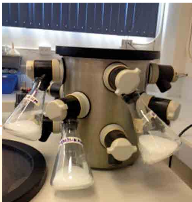
Figura 3. Secado por liofilización de nanopartículas para prolongar el tiempo de conservación en productos cárnicos.

Cada vez se utilizan más productos basados en la nanotecnología para elaborar materiales de contacto con los alimentos dotados de propiedades antimicrobianas (Daniells, 2007); por ejemplo, el innovador diseño de sensores capaces de detectar contaminación bacteriana y reaccionar contra ella. Analistas de la nanotecnología suponen que entre 150-600 nanoalimentos y 400-500 aplicaciones de nanoempaque para alimentos cárnicos, ya están en el mercado (Ozimek et al. , 2010); un ejemplo de lo anterior es el envoltorio plástico Dur-than® KU 2-2601, usado para