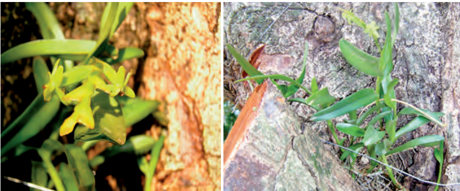
Epidendrum cardiophorum Schltr.