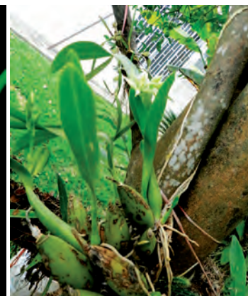
Prosthechea chacoensis (Lindl.) W.E. Higgins