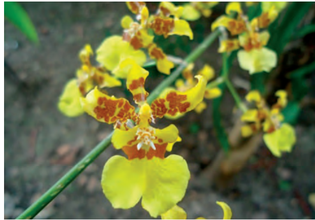
Oncidium sphacelatum Lindl., Sert.

queña brisa mueve en una danza frenética. Distribución: plantas terrestres y epifitas de amplia distribución en México; se encuentra en toda la vertiente del golfo, desde Tamaulipas hasta Quintana Roo, San Luis Potosí, Hidalgo, Puebla, Oaxaca y Chiapas, llega hasta Centroamérica. Hábitat: Esta especie puede encontrarse sobre rocas, troncos tirados, o bien, sobre árboles; es abundante en selvas medianas perennifolias, encinares tropicales y selva baja caducifolia. Forma grandes colonias con inflorescencias amarillas. Época de floración: marzo a mayo.