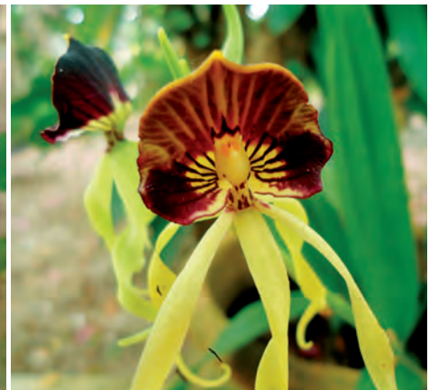
Prosthechea cochleata (L.) W.G. Higgins