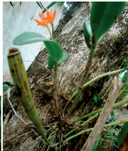
Género Guarianthe spp.

Guarianthe spp. es un género pequeño dentro de la familia Orchidaceae. Son plantas epifitas de las selvas húmedas de Centroamérica y norte de Sudamérica. Estaban incluidas en el género Cattleya spp., del que se han separado basándose en estudios filogenéticos, y posee cuatro especies. Distribución: México, Guatemala, El Salvador, Honduras y Nicaragua; crece desde 300 hasta 1600 m. Hábitat: forestas tropicales lluviosas de alta y baja montaña, así como forestas tropicales deciduas y semi-deciduas, forestas de pinares tropicales y, en el caso del centro y norte de México, en forestas del tipo boreal con predominancia de cedros, cipreses, sauces y fresnos. Época de floración: Marzo