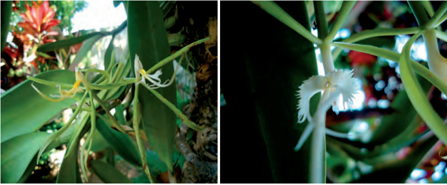
Epidendrum ciliare L.