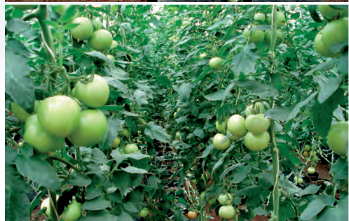
Figura 5. Producción de jitomate en invernadero; uno de los proyectos agropecuarios de mayor auspicio por los programas públicos asistenciales.