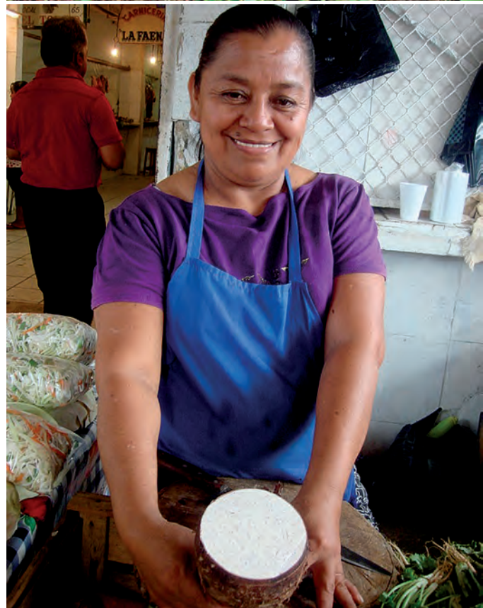
Figura 4. Jornales empleados por los miembros de la familia para productos de autoconsumo y comercio.