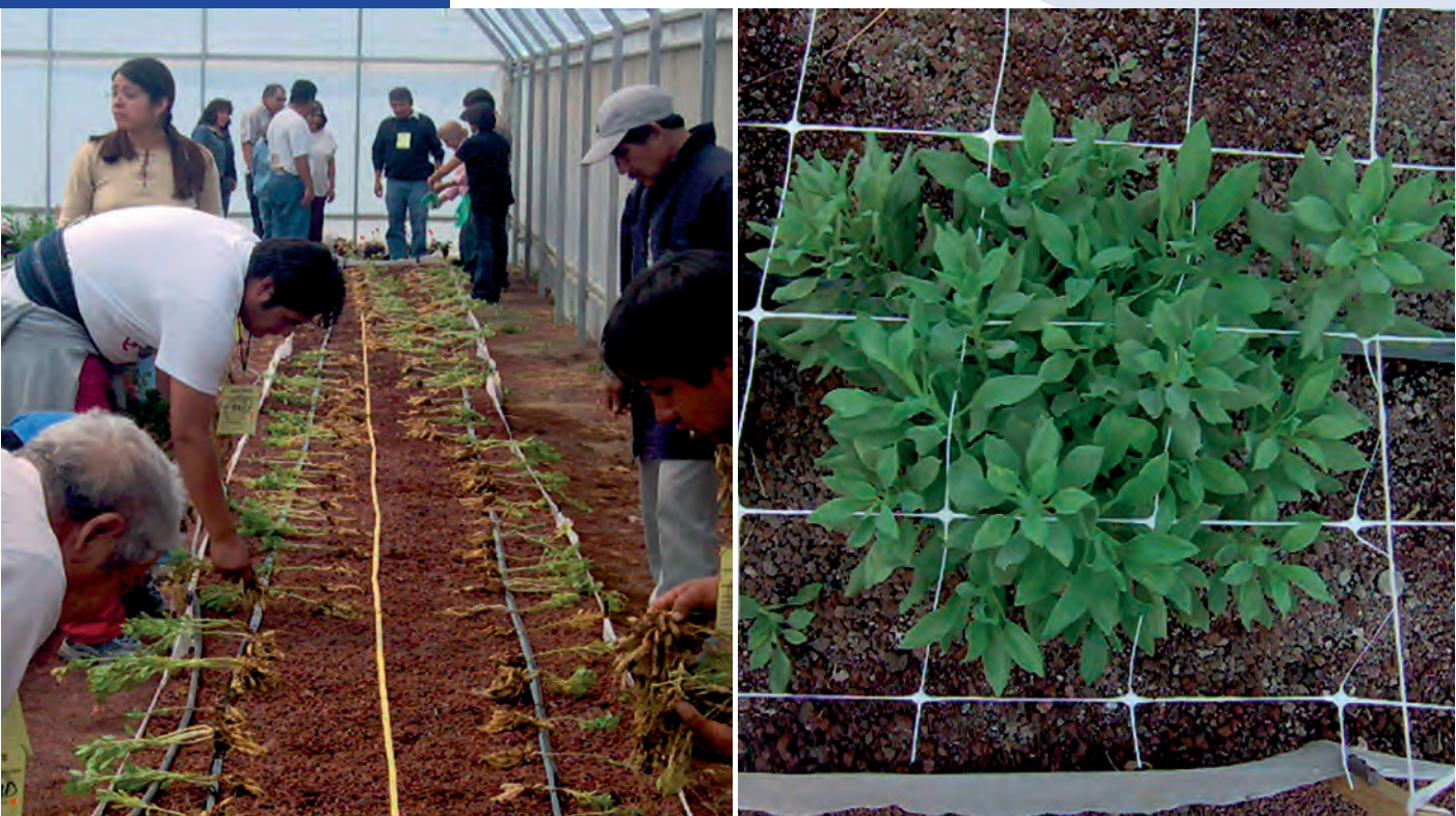
Figura 1. Proyectos productivos en áreas rurales enfocados a la producción de flor.

Los proyectos productivos agropecuarios pueden tener contribuciones insoslayables en la producción agropecuaria y, en el caso de incidir sobre la producción de básicos, en la seguridad alimentaria. Los datos sobre seguridad alimentaria se refieren a aquella población que tiene acceso físico y económico a suficientes alimentos inocuos y nutritivos en todo momento para satisfacer sus necesidades