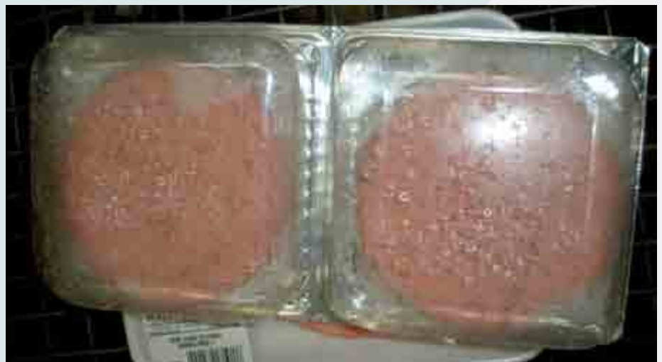
Figura 4. Carne para elaboración de hamburguesa empacada y conservada en refrigeración.

Los materiales que son utilizados en el empaque de los productos cárnicos son generalmente poliméricos con buenas características de barrera para el O_2 , como las poliamidas, el polietileno y el polipropileno, que son eficientes barreras contra la humedad y muestran buenas características de sellado (Pettersen et al. , 2004); el polietileno de baja densidad y el cloruro de polivinilo son los principales plásticos empleados en el empaque, aunque también se usa el poliestireno (Figura 4).