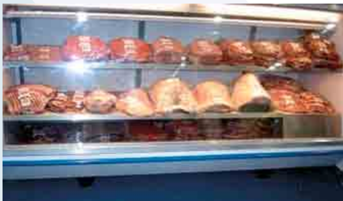
Figura 1. Carne conservada en empaques y expuesta a los consumidores

Los productos cárnicos se ubican dentro de los más fáciles de descomposición por ser un medio ideal de cultivo para microorganismos (patógenos y deteriorantes) (Ercolini et al., 2006; Villada et al., 2006). Uno de los aspectos más importante de cuidar para reducir su calidad es la inocuidad, de tal forma que el consumidor tenga garantía de que al ingerir ese alimento su salud no se dañará. Dentro de las características deseables por el consumidor, y que marcan la decisión de compra del producto, se encuentran la frescura y el color rojo estable y brillante de la su-