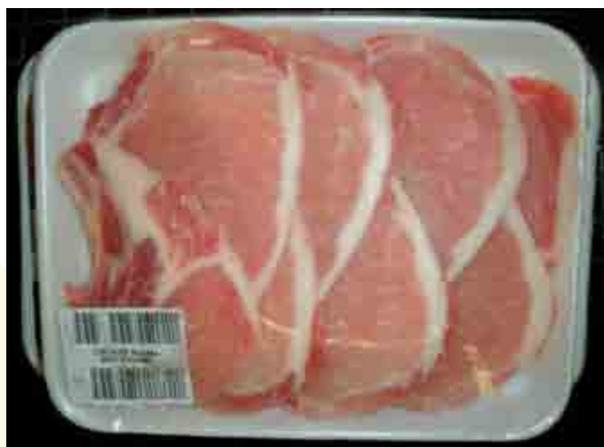
Figura 3. Chuletas de cerdo empacadas al vacío.

Consiste en eliminar el aire dentro del empaque que contiene la carne o producto cárnico, para posteriormente inyectar un gas o mezcla de gases. Se ha modificado el ambiente gaseoso a fin de reducir el grado de respiración y con ello disminuir el crecimiento microbiano y, por lo tanto, retrasar el deterioro debido a la producción de metabolitos microbianos y a la actividad enzimática residual de la carne; con ello