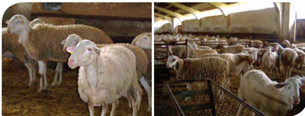
Figura 2. Ganaderías de ovejas de raza manchega inscritas en el Consejo Regulador de la Denominación de Origen en La-Mancha, España.