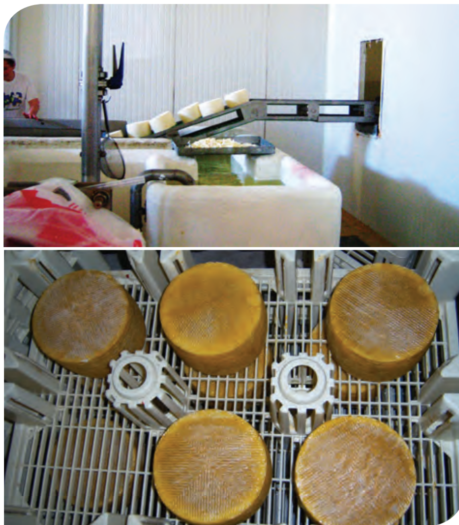
Figura 5. Proceso de salado y madurado del queso manchego.

Entre las características físicas del queso al término de su maduración destacan su forma cilíndrica con una altura de 7 a 12 cm, diámetro de 9 a 22 cm, y con peso entre 400 gramos y 4 kg como máximo en cada pieza (CRDO-QM, 2011). El queso manchego es un alimento que concentra todas las cualidades nutritivas de la leche, destacando su elevada proporción de proteínas, incluso por encima de la carne. En este queso están presentes las vitaminas A, D y E, básicas en procesos metabólicos como el crecimiento, la conservación de tejidos y la absorción de calcio (Martínez-Sánchez et al. , 2000; Gallago, 2002). La variedad de tipos de queso manchego incluye al curado con