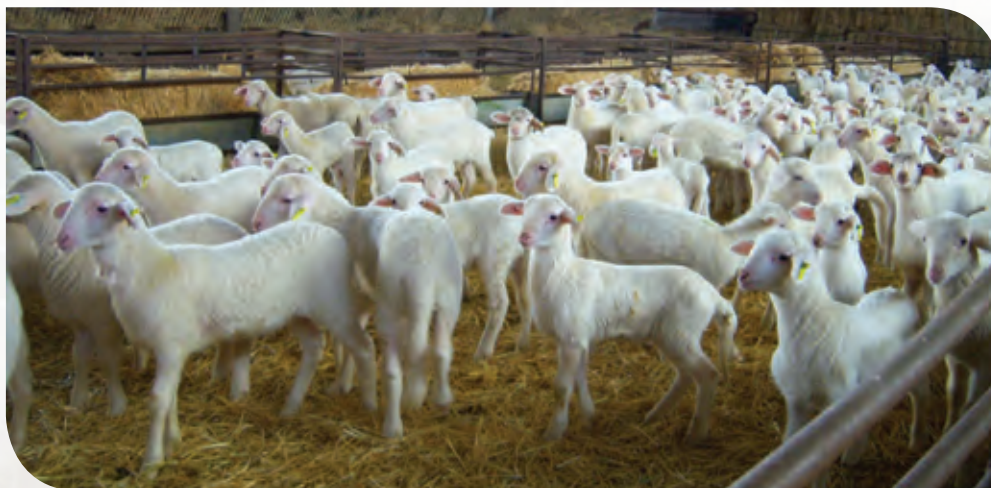
Figura 8. Rebaño de ovejas jóvenes de la raza manchega de la variante blanca, destinados a la industria cárnica.

Los Estados Unidos de América (USA) son el mayor importador de queso manchego con 1.3 millones de kilos, cifra importante teniendo en cuenta que el total de queso exportado fuera de Europa fue de 1.7 millones de kilos (INE, 2011). Los países europeos importaron poco más de dos millones de kilos, con el Reino Unido a la cabeza, seguido de Alemania, Francia y Austria (INE, 2011); por ello, además de consolidar los mercados actuales, se promueve la introducción a Japón, Noruega, Perú, Panamá y Chile, a través de la asistencia a ferias y congresos. Lo anterior ha permitido afianzar al queso manchego como