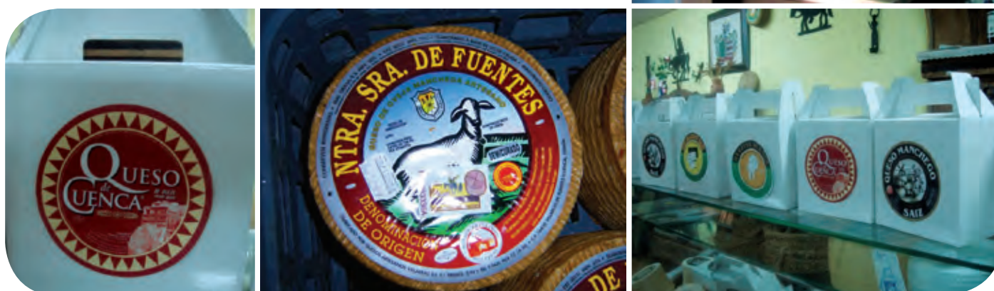
Figura 7. Diferentes presentaciones del queso manchego para venta local, regional y exterior.