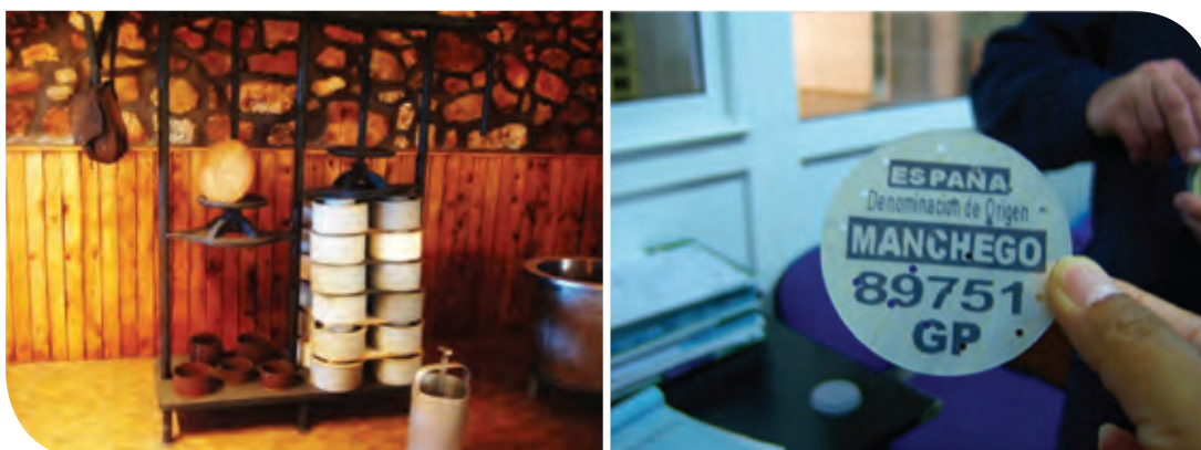
Figura 4. Prensa vertical y placa de caseína para la identificación individual del queso manchego.