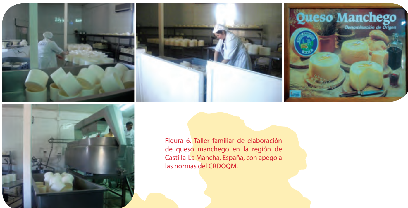
Figura 6. Taller familiar de elaboración de queso manchego en la región de Castilla-La Mancha, España, con apego a las normas del CRDOQM.