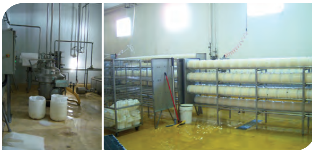
Figura 3. Proceso de eliminación de suero de la cuajada durante la elaboración del queso manchego.

Se extrae la cuajada del molde cuando ya ha adquirido la forma cilíndrica y, tras invertir la posición de las caras planas del cilindro, se vuelve a introducir en el mismo para some-