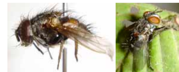
Fig. 6. Adulto de C. reclinata ; A. Macho; B. hembra.

Adulto. El adulto es un insecto de cuerpo blando y mediano, de 7 a 8 mm de tamaño; presentan antenas de tres segmentos con arista desnuda. El cuerpo es color oscuro con líneas grises sobre el dorso de tórax y ojos rojizos; como todos los miembros de la familia Tachinidae presenta el escutelo prominente. Existen ciertas diferencia entre hembras y machos; la más visible es la mancha naranja que presentan los machos sobre la región pleural de los primeros segmentos del abdomen (Figura 6)