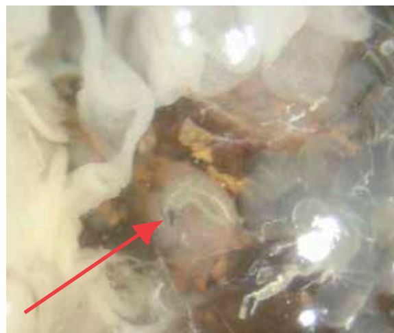
Fig. 4. Larva de 1er. ínstar de C. reclinata

habían muerto. Por lo tanto, esta dieta no es la adecuada para C. reclinata . Se optó por utilizar un hospedante alternativo. Se utilizaron pupas no parasitadas de otro lepidóptero ( Nymphalis antiopa L.), en las que se realizó un corte transversal en los últimos segmentos del abdomen para introducir larvas de C. reclinata y que continuaran su desarrollo. A pesar de que se logró mantener vivas las larvas por más tiempo, éstas finalmente no se adaptaron al cambio y murieron. Al realizar las disecciones, las larvas se encontraron muy cercanas a las tráqueas del hospedante (Figura 4) lo que hace inferir que, como lo señala Clausen (1940), éstas anclan los espiráculos a las tráqueas del