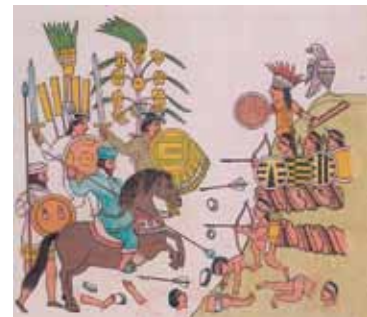
Figura 3. Detalle del mural de Diego Rivera en el Palacio Nacional, México, D.F.

Sánchez Mastranzo N. A. 2004. El lienzo de Tlaxcala. Consultado en línea el 25 de enero 2009. www.essex.ac.uk/conferences/fourthworld/nazariopaper.pdf