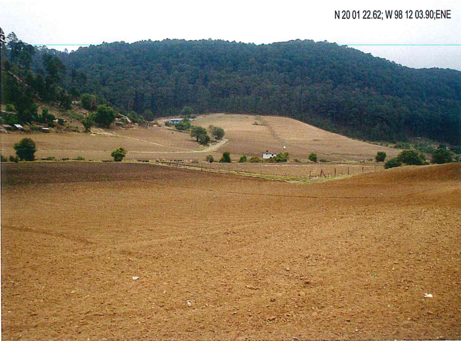
Figura 3. Imagen a la que se agregó la información geográfica.

El programa Exif Reader permite ver la totalidad de la información de la fotografía visualizada y si ésta ha sido correctamente codificada, ya que precisamente la información geográfica se agrega en este apartado sin alterar la información correspondiente a la imagen