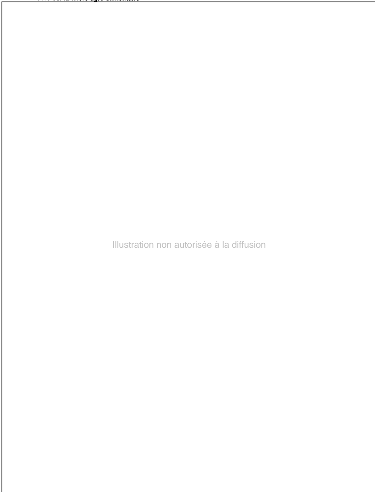
Graphique 6 Soldes relatifs sur la filière agro-alimentaire

Illustration non autorisée à la diffusion