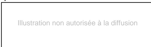
Tableau 5. Évolution des emplois ruraux par secteurs d'activités

Si l'on retient le concept de population active au lieu de travail, on peut constater ( tableau 5 ) un recul très sensible du taux d'emploi agricole dans les zones rurales qui est passé de 51,5 % en 1968 à 27,3 % de l'emploi local en 1990. L'évolution de ce taux ne dépend pas que de celle des actifs agricoles, elle est de plus en plus fonction de la dynamique de création d'activités nouvelles dans les autres secteurs de l'économie. Aujourd'hui il n'y a plus de corrélations entre la variation de la population agricole et celle de la population rurale.