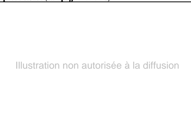
Graphique 2. Coûts « carreau usine » dans quelques pays producteurs (campagne 1990-91)