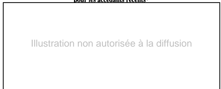
Tableau 1. - Coût relatif des logements par taille de commune pour les accédants récents*

Source : INRA-Dijon d'après INSEE (enquête logement 1988). Délimitation communale 1982