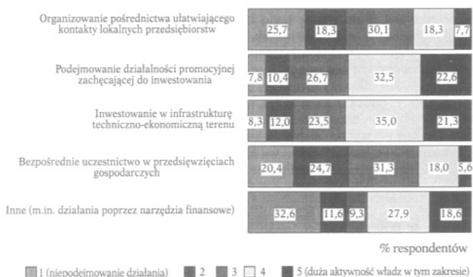
Rys. 3. Ocena w skali 1 do 5 działań podejmowanych przez gminy dla rozwoju lokalnej przedsiębiorczości

Wśród ogółu działań podejmowanych przez gminy dla celów pobudzania rozwoju lokalnej przedsiębiorczości daje się wyróżnić pięć zasadniczych grup, w zakresie których aktywność poszczególnych gmin – jak wynika z przeprowadzonych badań – jest dość zróżnicowana. Samoocena tej aktywności dokonana została przez respondentów w skali 1-5, gdzie 1 oznacza niepodejmowanie danego działania przez władze gminy, a nr 5 dużą aktywność władz gminy w tym zakresie – rys. 3.