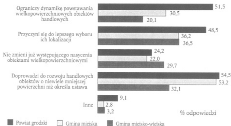
Rys. 2. Ocena przydatności znowelizowanej ustawy dla regulowania procesu powstawania handlowych obiektów wielkopowierzchniowych