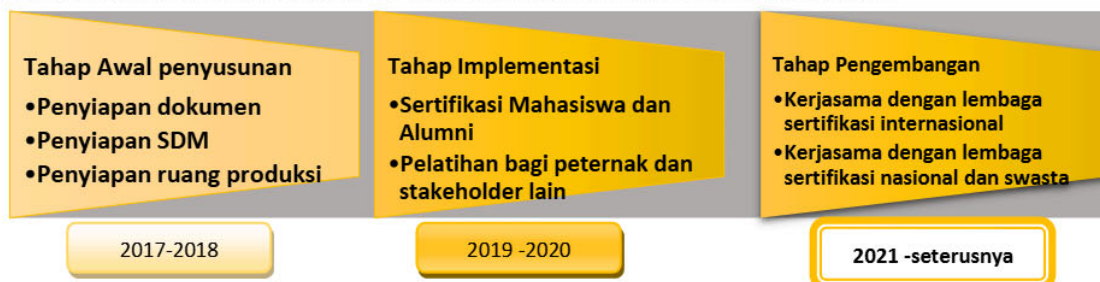
Gambar 2. Road Map Pengembangan Teaching Industry Maiwa Breeding Center Unhas

Perkembangan Teaching industry MBC dapat dilihat pada ilustrasi Gambar 2 berikut ini: