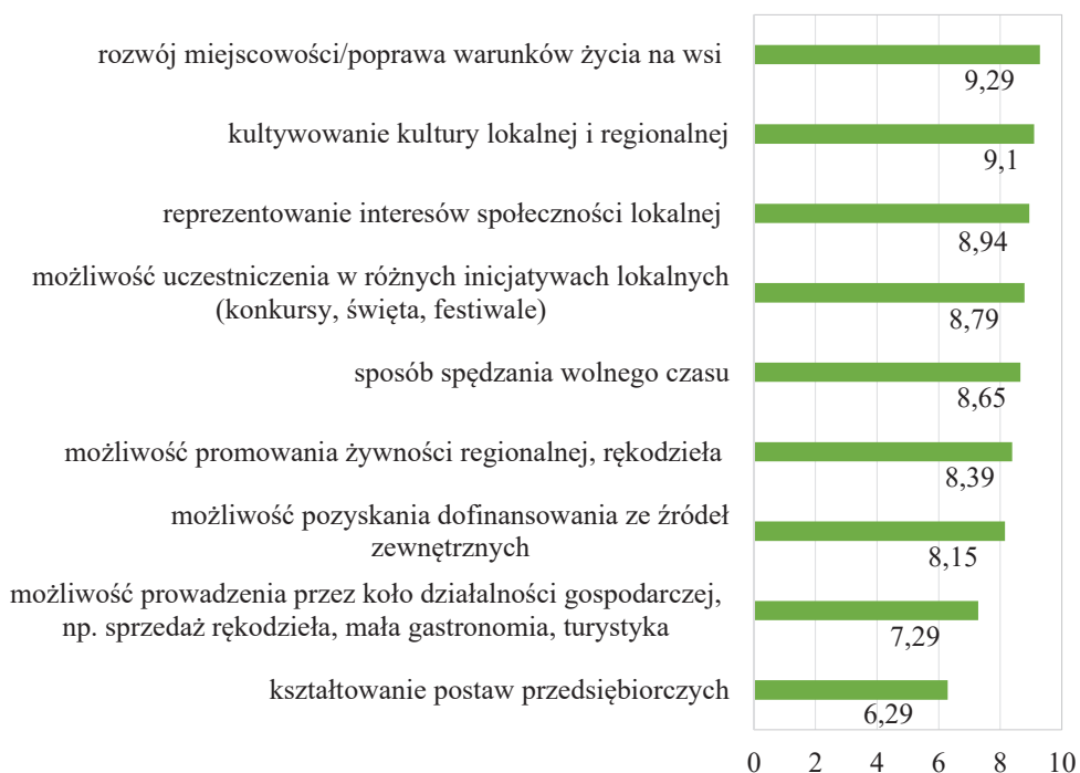
Rysunek 2. Motywy przystępowania do KGW (skala od 0 do 10)