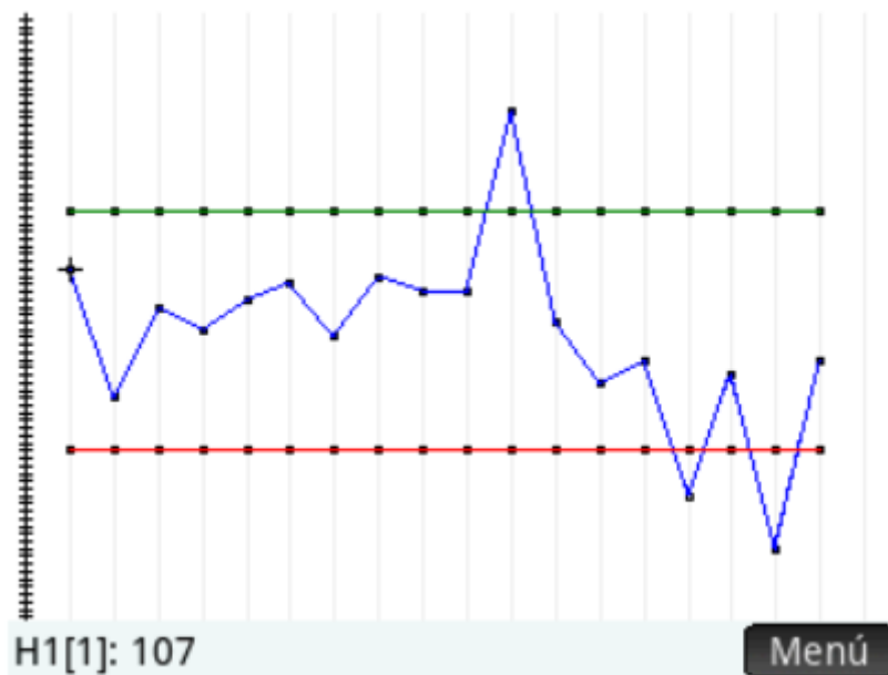
FIGURA 5. Límites de variación del recobrado de clorpirifos en mani.

Con la tecla Plot se obtiene la gráfica de la figura 5. Donde se observan claramente los puntos “outliers” y los límites de variación de los valores de recobrado de clorpirifos en mani