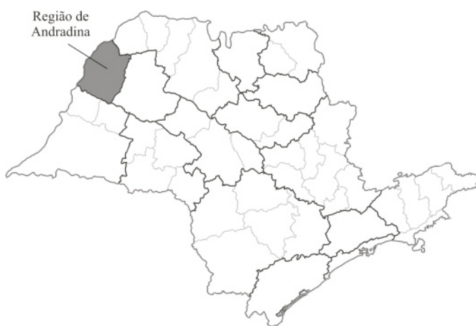
Figura 1. Regiões de governo do estado de São Paulo, com destaque para a região de Andradina, onde situam-se os oito assentamentos pesquisados.