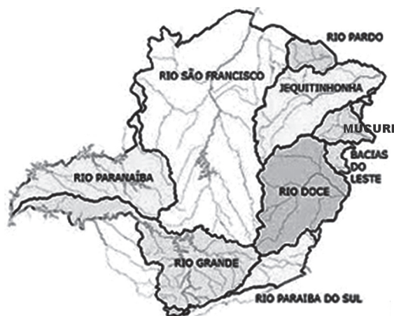
Figura 1. Bacias hidrográficas de Minas Gerais

estado de Minas Gerais e o restante na Bahia e Espírito Santo, não têm dados para 2000; porém, é possível perceber que a sua qualidade da água é razoavelmente boa, justamente por ser classificada em 2010 como próxima à média do IQA de outras bacias. A moderada qualidade se associa aos efluentes nos corpos hídricos, frequentemente gerados por diversas atividades econômicas ali próximas (e.g., agropecuária, reflorestamento, turismo, lapidação de pedras preciosas, pecuária, geração de energia, abastecimento público e industrial, e piscicultura) (EUCLYDES et al. , 2011). Por sua vez, a bacia do rio Jequitinhonha, que tem área de 70.315 km 2 , passando por 63 municípios, estando a