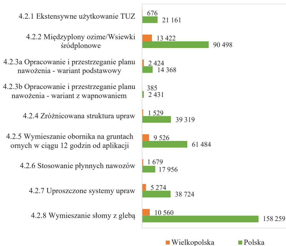
Rysunek 3. Popularność praktyk w ramach ekoschematu „Rolnictwo węglowe” (stan na 31.05.2023)

Źródło: opracowanie własne na podstawie danych ARiMR