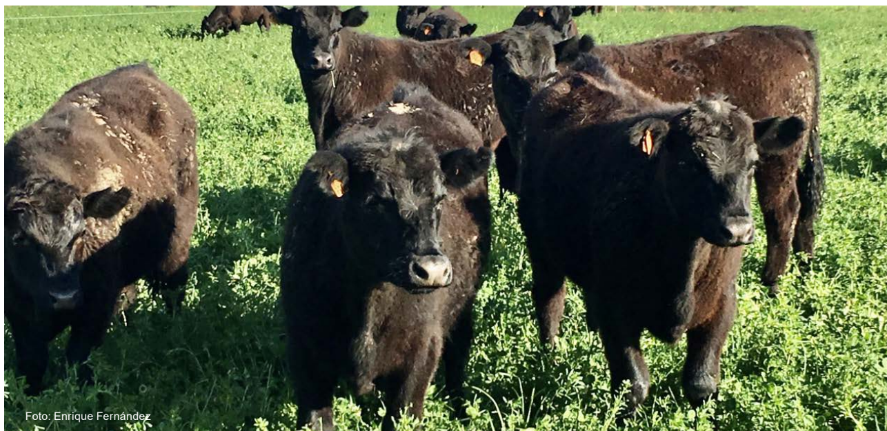
Figura 3 - Engorde de novillos sobre alfalfa en INIA La Estanzuela.

• No es de despreciar la reputación que adquiere el ganadero con buena genética frente a la industria, que a menudo premia con algunos centavos más en el precio a aquellos ganados de productores que consistentemente muestran rendimientos superiores en su calidad industrial.