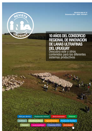
Foto de tapa: actividad de campo en el marco del CRILU.

INSTITUTO NACIONAL DE INVESTIGACIÓN AGROPECUARIA