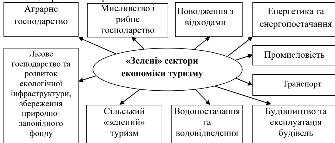
Рис. 2. Першочергові види економічної діяльності щодо впровадження засад «зеленої» економіки

у досягненні сталого розвитку. Сучасні дослідження щодо перспектив упровадження «зеленої» економіки дозволяють визначити пріоритетні для неї перспективні види економічної діяльності в упровадженні засад «зеленої» економіки і на які варто звернути першочергову увагу. Ці «зелені» сектори економіки відображено на рис. 2.