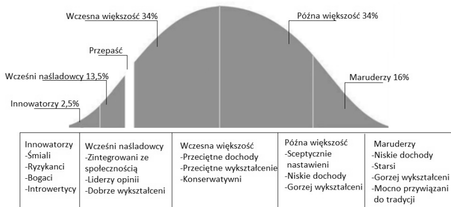
Rys. 2. Model dyfuzji innowacji E.M. Rogersa