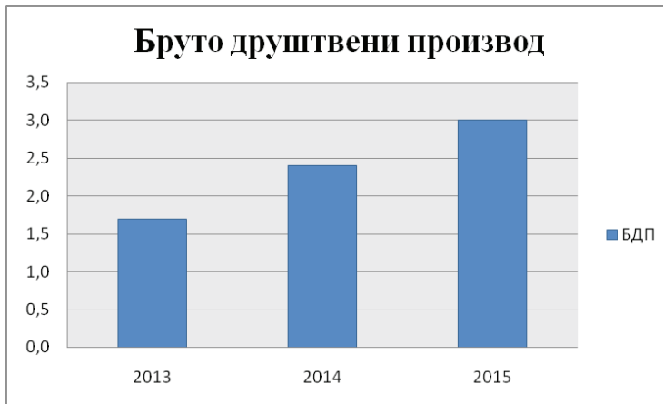
Графикон бр. 2: Кретање БДП-а у Русији у 2013,2014 и 2015 години.